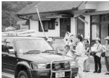
街頭キャンペーン(北警察署管内)

ードで、ドライバーや歩行者に交通安全を呼びかけました。対馬市では、今年に入り9月末までで3名の方が交通事故で亡くなっています。交通规则を守って、安全運転に心がけましょう。