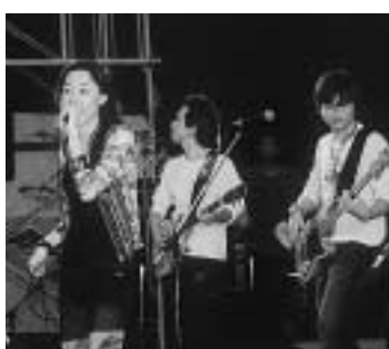
韓国のロックバンド『LOVEHOLIC』