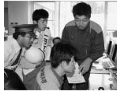
指令の出し方の説明を受ける