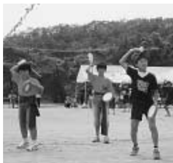
南小(エイサー『遊び庭』)

また、同日、豊玉中学校グラウンドでも、同校運動会が行われ、大漁旗で作ったハッピを着て演じられた「ソーラン節」は、曇り空を吹き飛ばすほど元気いっぱいこの演技で、会場は大きな歓声と拍手に包まれました。