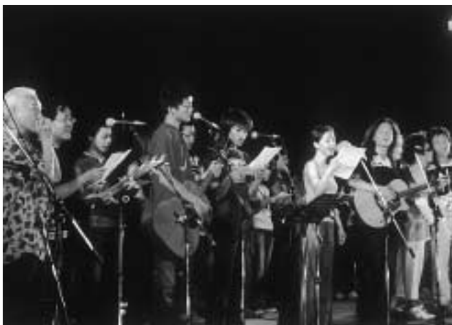
コンサートの最後、出演者全員で『ちんぐソング』のコーラス

ステージの最後は、ちんぐ音楽祭で生まれた「ちんぐソング」を出演者全員で合唱して、音楽祭の最後を飾りました。会場につめかけた観客は、日韓のアーティストの競演に惜しめない拍手を送っていました。また、音楽祭終了後には出演したアーティストとの交流会も開かれ、参加した観客は食事をしながら、交流を楽しんでいました。