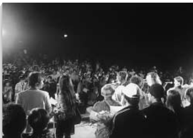
会場全体でちんぐソングの合唱