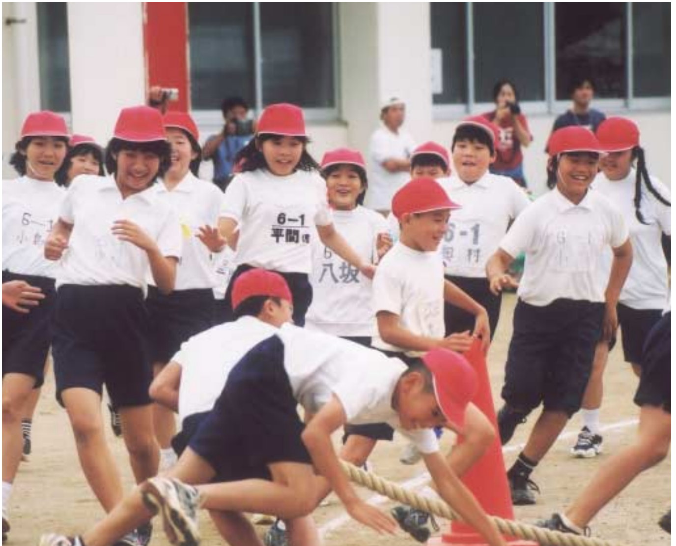
全校児童294人による時間差綱引き(久田小運動会)