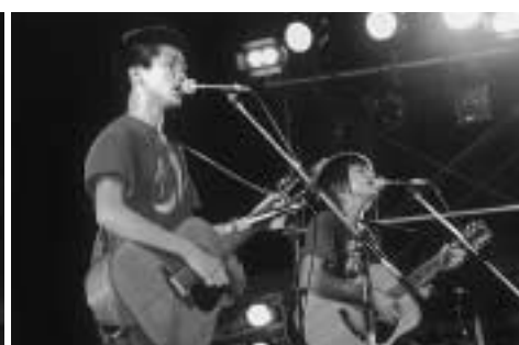
兄弟デュオの『平川地一丁目』