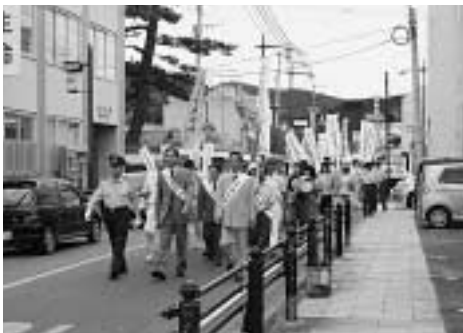
交通安全パレード(南警察署管内)