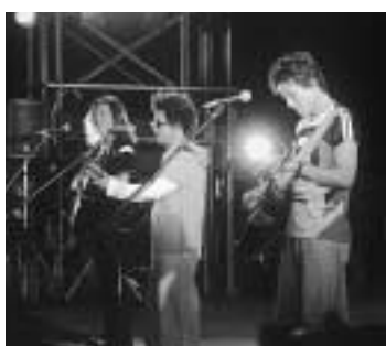
韓国の生ギターグループ『自転車に乗った風景』