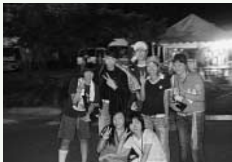
招待された高校生

最後に、熱気あつあつの舞台とその観客達を一つに結びつけるエンディングソング、「ちんぐソング」。