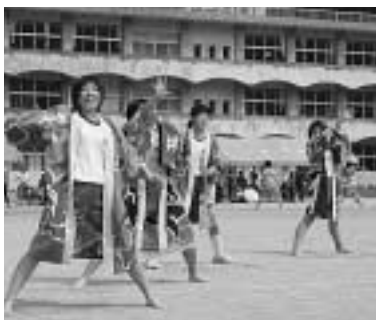
豊玉中『ソーラン節』