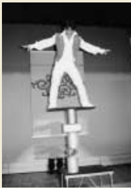
ローリングバランス

演目 / 中国獅子舞 / 皿回し / ローリングバランス / 足芸 / 高車蹴腕 / 高椅子倒立 / 中国語にみんなでトライ / 片手散歩 逆さまお父さん