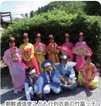
朝鮮通信使子ども行列衣装の竹富っ子