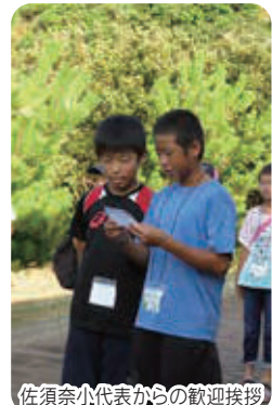
佐須奈小代表からの歓迎挨拶

友好都市協定を締結している沖縄県竹富町から小学生10人が対馬の歴史や自然などを学ぶ環境スタディツアーで来島しました。佐須奈小学校との交流、朝鮮通信使子ども行列への参加など、夏の対馬で学び、たくさんの思い出を作りました。