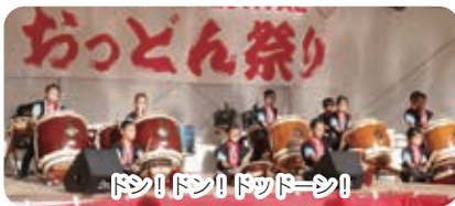
ドン!ドン!ドッーッ!