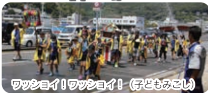
ワッショイ!ワッショイ! (子どもみこし)