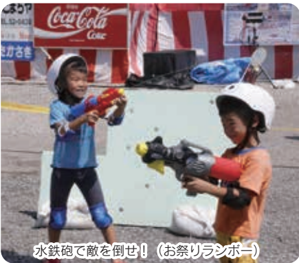
水鉄砲で敵を倒せ! (お祭りランボー)