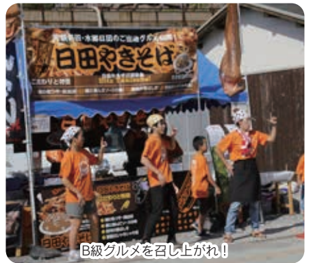
B級グルメを召し上がれ!

厳原港特設ステージで「対馬厳原港まつり」が開催されました。子どもみこしやお祭りランボー・舟グロー大会・朝鮮通信使行列などで大いに盛り上がりました。また、上対馬町比田勝港埋め立て地で「おっどん祭り」が開催され、ローカルヒーローショーや対馬愛鼓連の太鼓の演奏で賑わいました。同時開催で行われたB-1グランプリでは6団体が各地のローカルフードを出展しました。両イベントのラストには、夏の夜空を彩る平成最後の「対馬の花火大会」が行われ、訪れた市民を魅了しました。