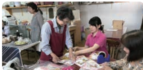
たくさんの人たちが協力しています。

地域のため、そして、ここに集うみんなのために、その想いが作り出した「楽しみながら自分たちで運営できる仕組み」がここにはあります。