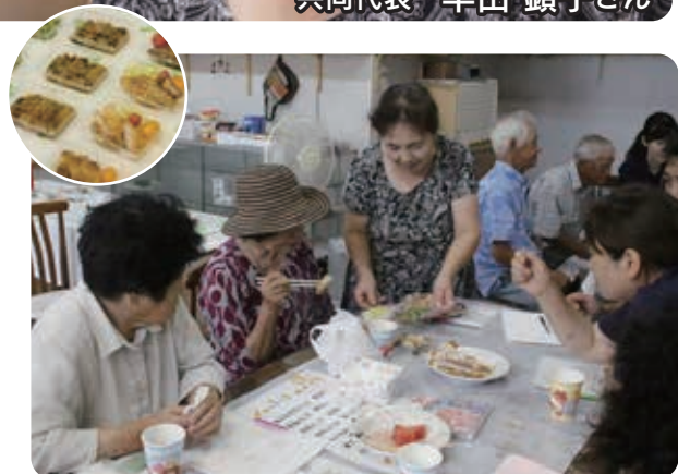
地物を使った惣菜は評判の味