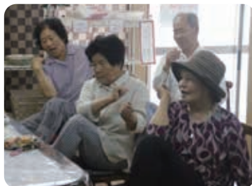
みんながいるから頑張れる!みんなでやるから楽しい♪健康体操