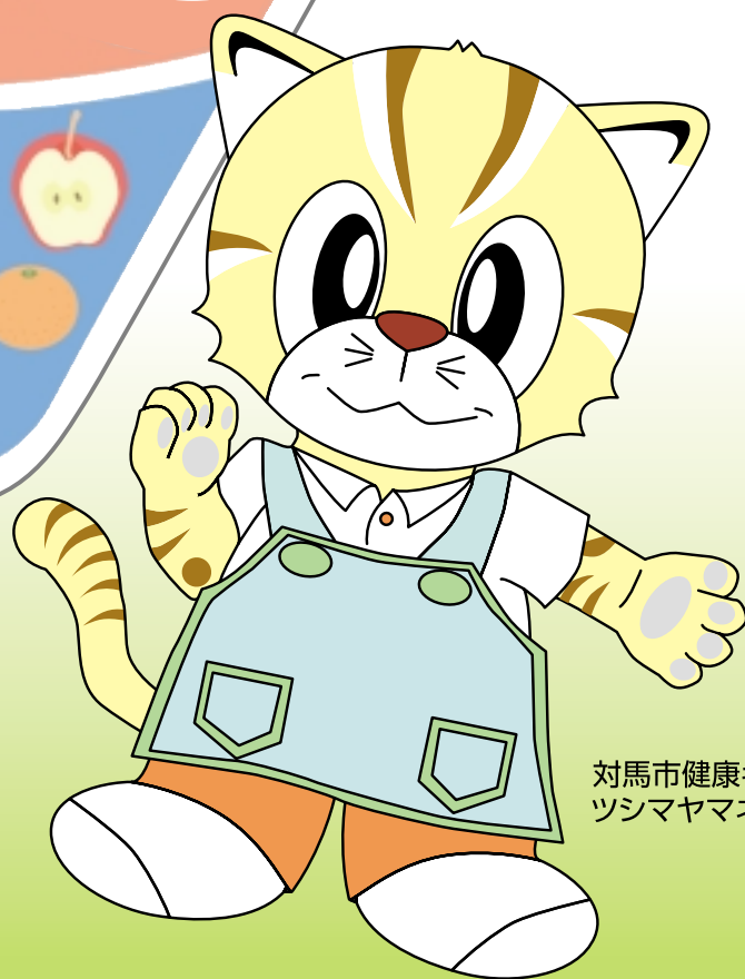
対馬市健康キャラクター ツシマヤマネコ タクト君