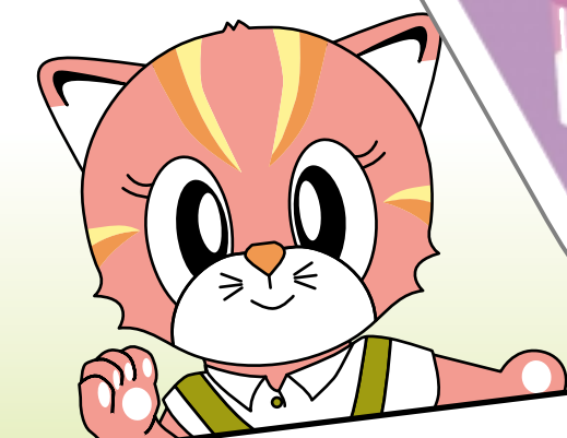
ツシマヤマネコ ヘルシーちゃん