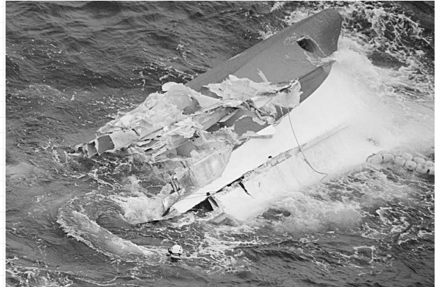
（11月27日に貨物船と衝突し大破した漁船）