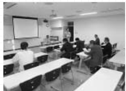
産業建設常任委員会