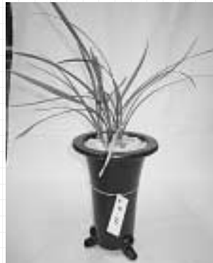
寒 蘭 （¥1,200）