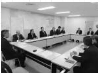
総務文教常任委員会

今後は、調査結果をもとに各常任委員会が所管する事業について検証を行い、より良い住民サービスが提供できるよう引き続き調査・研究を重ねてまいります。