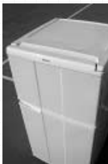
ハイアール冷蔵庫 （¥4,000）