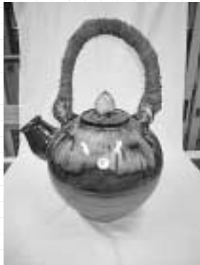
小石原焼 急須の置物 （¥40,000）