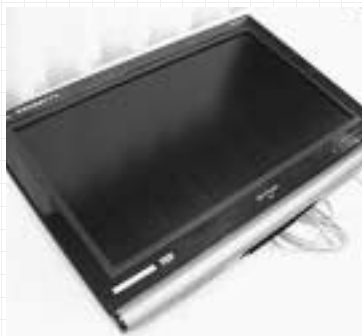
シャープ アクオス 26型 壁掛け型 （¥8,000）