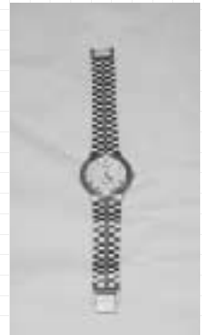
セイコードルチェ （¥5,000）