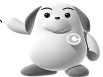
税関イメージキャラクター カスタム君