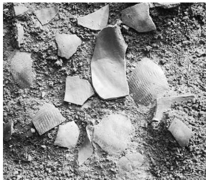
上対馬町東海岸の主な古墳 古里古墳(6世紀) コフノサエ古墳群(5〜7世紀) 朝日山古墳(5世紀)

時代は6世紀から8世紀、遺物は須恵器(窯で焼いた土器)、土師器、野焼きの土器、三国土器(韓国)、新羅土器(韓国)、製塩土器、塩を作る土器、叩石(ハンマー)、砥石などですが、7世紀の土師器が最も多く出土しています。