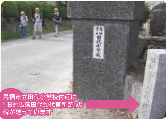
鳥栖市立田代小学校付近に 「旧対馬藩田代領代官所跡」の 碑が建っています

平成21年度から開催している「対馬学への招待」。対馬を深く知っていただくために、自然、歴史、グルメ、アウトドアと毎回異なるテーマでお送りしています。