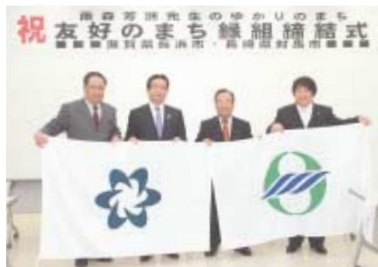
左から吉田長浜市議会議長・藤井長浜市長 作元対馬市議会議長・財部対馬市長