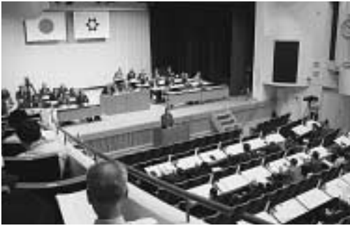
議会で施政方針を述べる市長

欲と能力と養う生涯学習活動を支援するために、スポーツ教室や公民館講座の開催を行うほか、各種事業を進めるとともに、青少年劇場開催、対馬市制発足記念縦断ウォーキング補助、文化財案内リーフレット作成、対馬島郷土芸能保存会補助、対馬ヤマネコを守る会補助、対馬体育協会補助、スポーツ活動振興補助、スポーツ少年団育成補助、青少年健全育成協議会補助、PTA運営補助、雨森芳洲没後二百五十年記念事業補助、ふるさと体験館設計委託、清水山城跡外保存整備事業、金田城跡保存整備、宗家文庫資料等保存施設計画策定事業、公会堂空調改修基本計画調査委託及び公会堂行事開催委託等を計上しています。