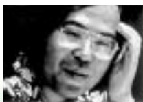
文化講演 / 荒 俣 宏 氏 (翻訳家・作家)