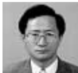
学術講演 / 金 鏡 範 氏 (釜山大学教授)