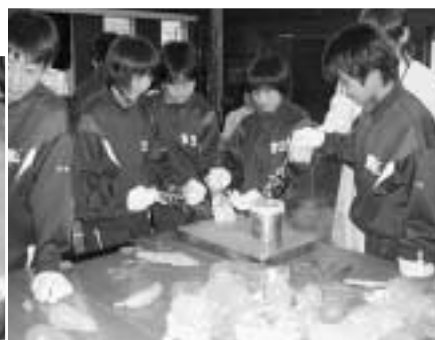
液体チツソに花を