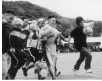
30kgの砂袋を持って走る