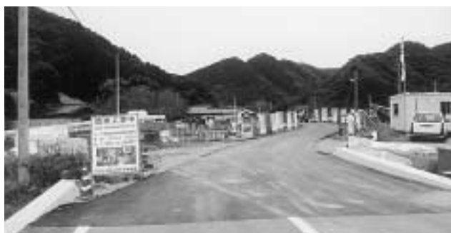
吉田曾線道路改良工事