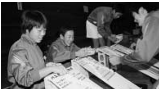
パスカルの三角形で確率のゲーム