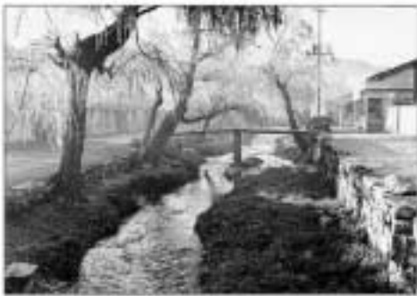
写真No.53 「藤原町の川端通り」(昭和30年代?)