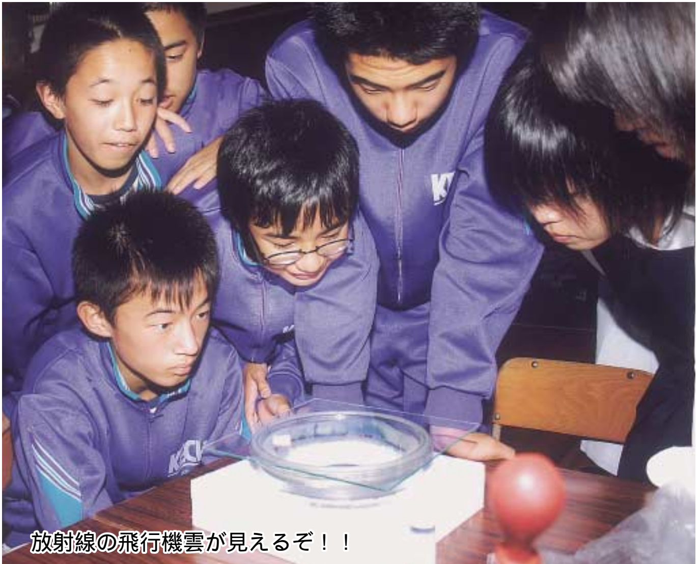
放射線の飛行機雲が見えるぞ！！