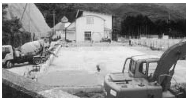
大調小学校屋内運動場新築工事