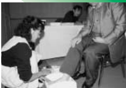
骨密度測定の様子

事業は、骨密度測定やリハビリ、行政などの健康相談をはじめ、内科、整形外科、食事と栄養の健康講話、健康体操の指導などがありました。