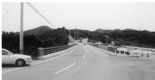
赤島線道路改良工事