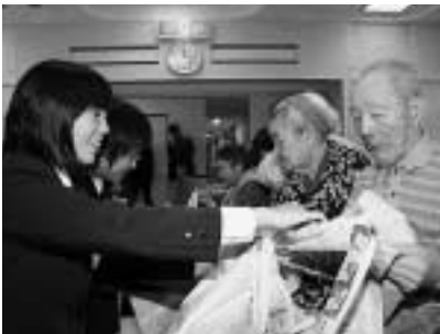
対馬養護老人ホーム

設で活躍中の「福祉」「医療」の国家資格取得者の講師から資格の説明や仕事の内容、職場の紹介、どうしたら資格が取得できるのかなどの貴重な体験談を聞きました。