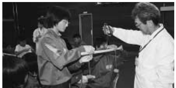
てこの原理を学ぶ うまくつりあうかな