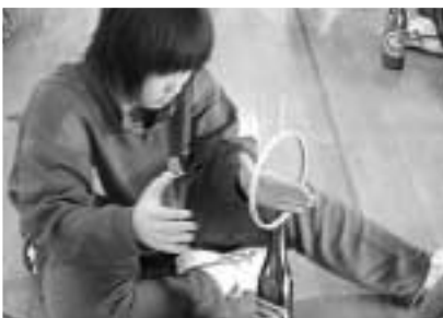
ピンがうまく入るかな？

実験も、てこの原理や大気圧、慣性の法則を利用したもので、とても楽しく勉強になることばかりでした。一番印象に残っているのは、大気圧の実験と液体窒素の実験が面白かったです。今日いろいろな実験で、たくさんを知ることができて本当に良い勉強になりました。