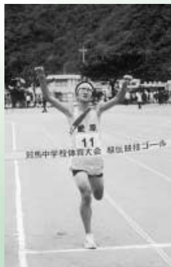
新記録で優勝敵原中男子