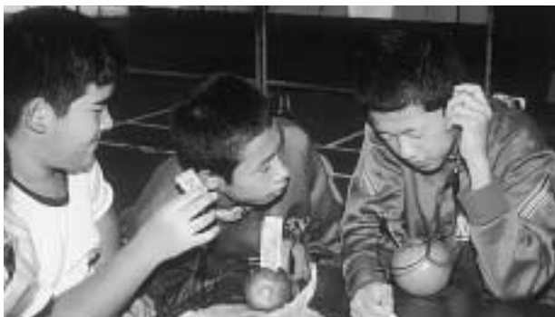
くだもの電池で音楽