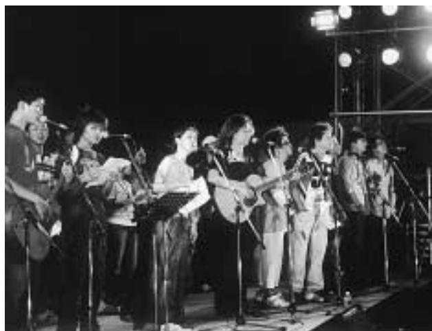
出演者全員による全体セッション(04'8月)

ご協力いただける方は、対馬ちんぐ音楽祭実行委員会事務局に7月29日(金)までご連絡ください。