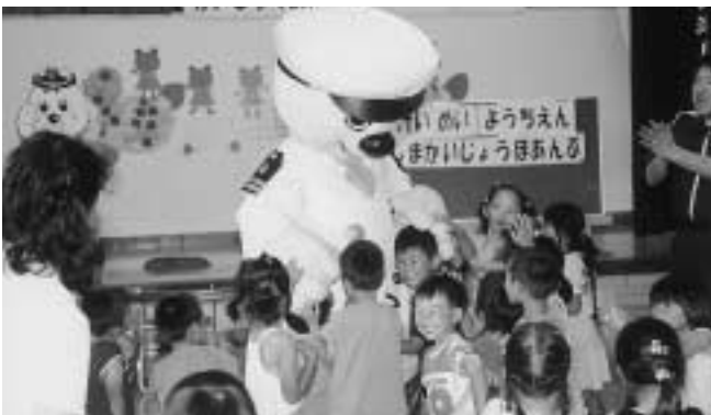
うみまる君は大人気

教室終了後は、海上保安庁のマスコット「うみまる君」が登場し、園児たちと記念撮影をしました。