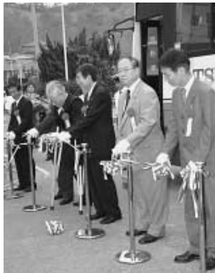
観光シャトルバスの前でテープカット

今までは釜山から対馬までの乗船券代と比田勝から厳原までのバス代が必要でしたが「観光シャトルバス」を利用すると3000円程度格安になり、個人観光客増加策として、県と市が協力して実施するものです。