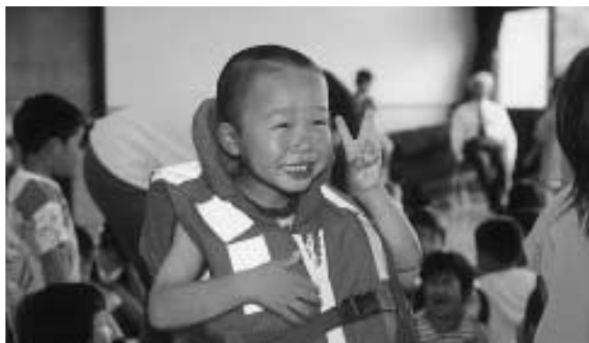
ライフジャケットを着てごきげん