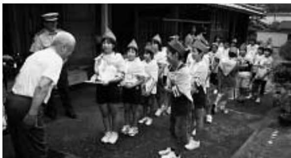
仁位では交通少年団がお年寄りを訪ねました