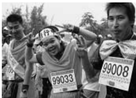
おめかしてウォーキング