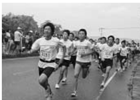
スタートから真剣勝負(3km)