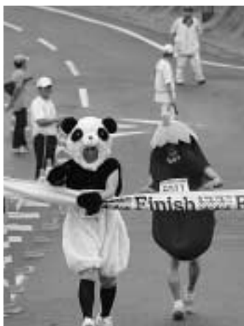
着ぐるみで5kmを完走 ごくろうさまです