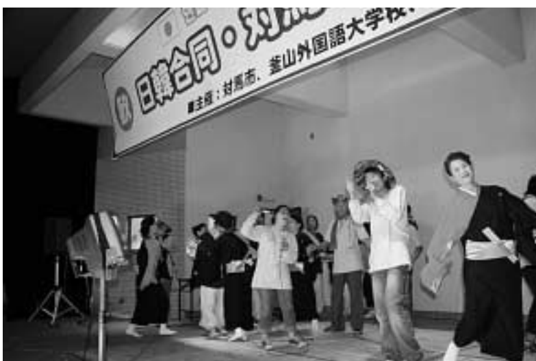
盛り上がった文化交流会