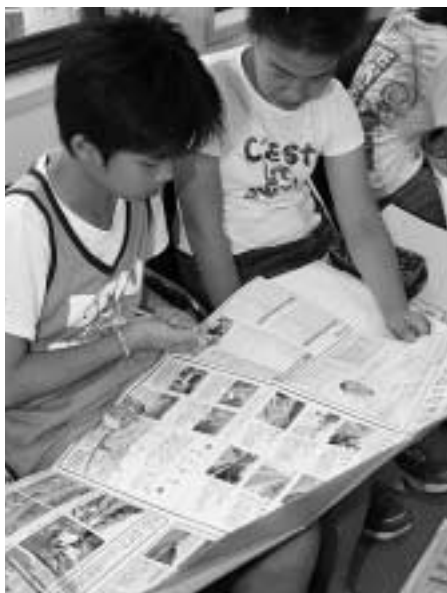
熱心に説明を聞く6年生

説明を受けた子ども達からは、「一級河川と二級河川の違いは?」、「護岸に穴が開いているのはなぜ?」、「なぜ川に草が残っているのか?」、「雞知川の汚れは対馬市で何番目?」、「川にはどんな生き物がいますか?」など次々と質問があり、講師も回答に困る場面もありました。