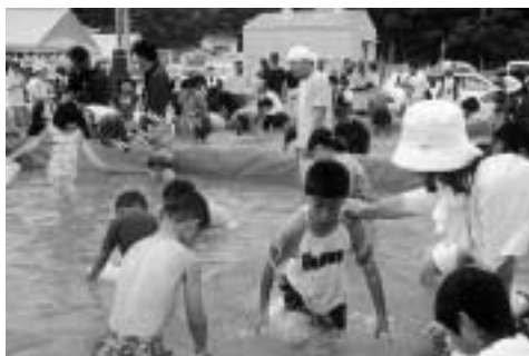
あっ!!そっちに行った(うなぎ取りゲーム)

フィナーレを飾る花火も盛大に1000発が打ち上げられ、たくさんの方が、今年最初の夏祭りを楽しみました。