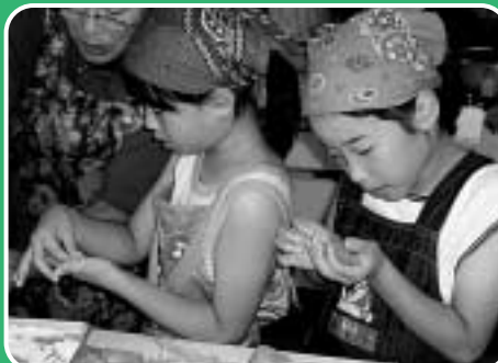
南陽小学校の皆さんと家庭料理教室の様子