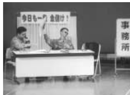
昨年実施した振り込め詐欺被害防止講話での寸劇(上対馬総合センター)