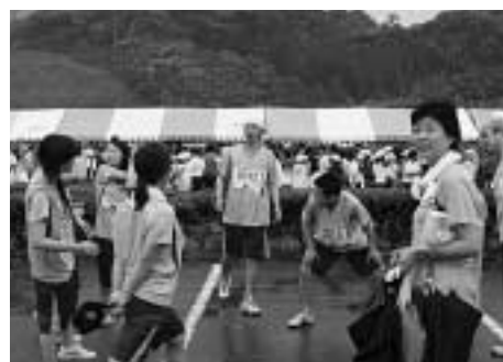
しっかりウォーミングアップ