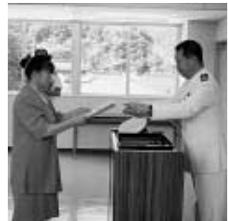
表彰を受ける修行さん

7月18日「海の日」に、比田勝海上保安署で、海上の安全を守る啓発活動や海洋環境を守る活動に貢献した方々の表彰が行われました。