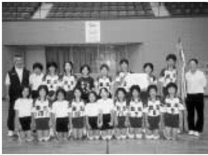
女子優勝の豊玉ジュニア

この男女の優勝チームと女子2位の仁田小ジュニア、3位の峰西ジュニアの4チームは、8月28日に大村市（男子は佐世保）で行われる第28回小学生長崎県バレーボール大会に出場します。