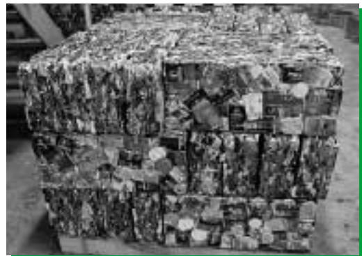
対馬クリーンセンターでプレス加工されたスチール缶

公共施設等での禁煙や分煙が進む中、愛煙家の皆さんにはとても面倒なお願いですが、リサイクルの推進とごみの減量化のために、空き缶を灰皿の代わりにしないようご協力をお願いします。