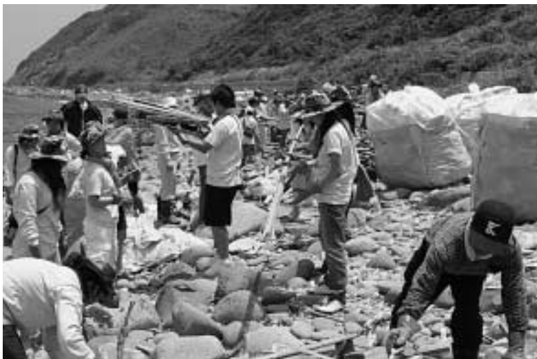
アジサイロード下での海岸清掃の様子

れていて、延べ850名（韓国学生126名、一般協力者724名）が参加した2日間の作業で、650立方メートル（4トントラック60台分）もの漂着ゴミを回収しました。また、この清掃作業のほかにも、グラウンドゴルフでのスポーツ交流や、両国の伝統芸能や料理などで文化交流も行いました。