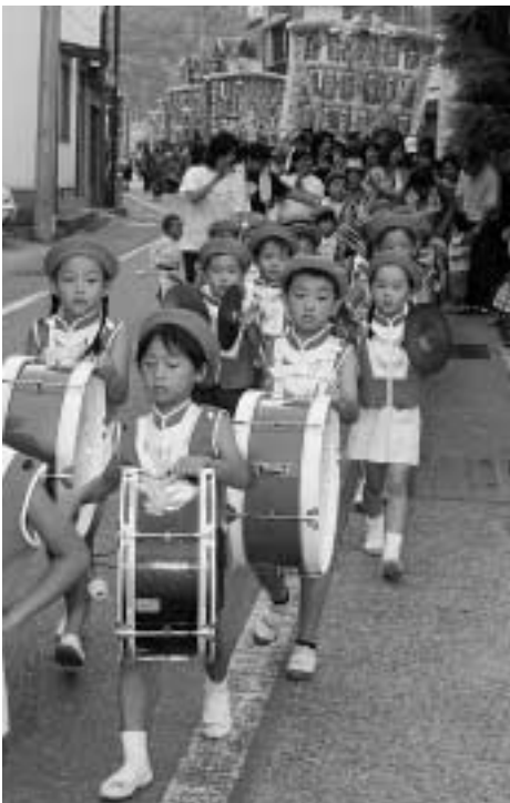
鶏鳴幼稚園児を先頭に山笠行列