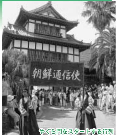
やぐら門をスタートする行列