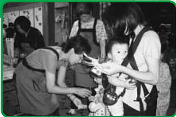
「せん団子の黒蜜を振るまう推進員」

平らにしたものを熱湯で茹でる。 ゆで汁を捨て、熱いうちに小さく砕いた黒砂糖を入れ、混ぜ合わせる。