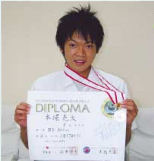
メダルと賞状を手に会心の笑顔