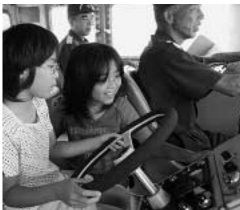
ゲームしてるみたいで楽しいね