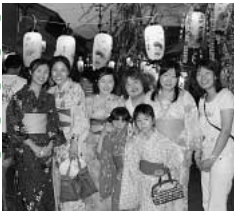
浴衣を着て地蔵盆見学

このホームステイは、対馬観光物産協会厳原支部が実施したもので、受け入れた家族からは、「今回の受入れで、純粹で前向きな釜慶大学生に接し、心が洗われたような経験をさせてもらいました」との感想が寄せられました。