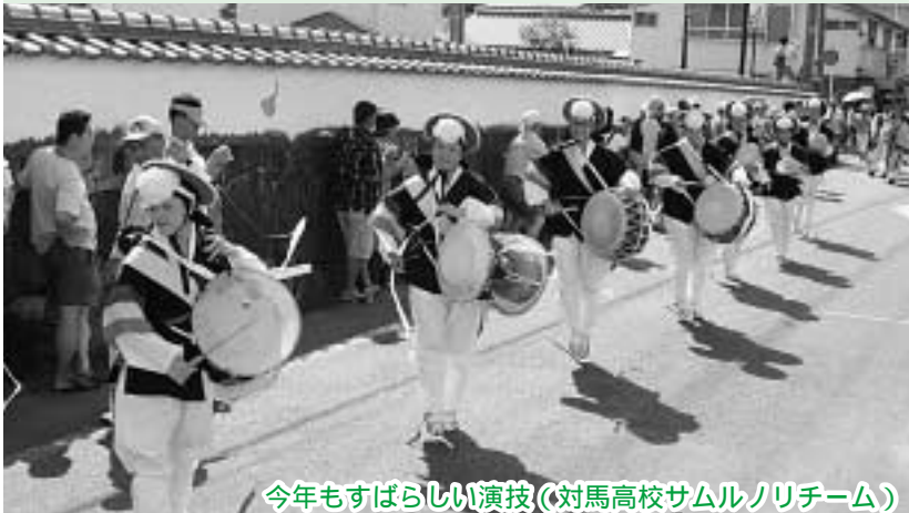
今年もすばらしい演技(対馬高校サムルノリチーム)