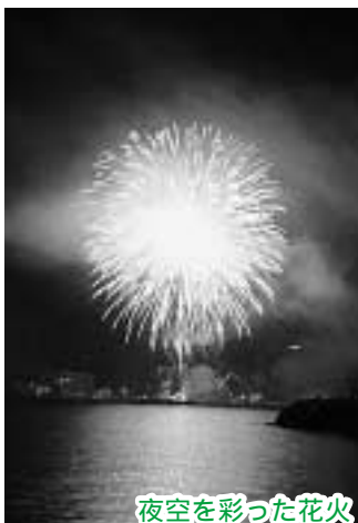
夜空を彩った花火