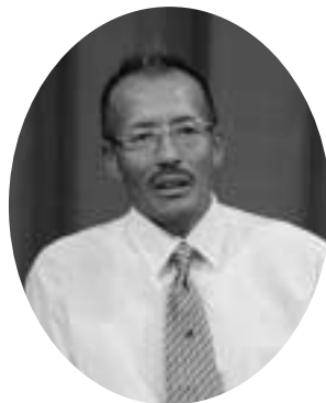
後継者問題を話す 扇さん

「扇」これは後継者問題に通じるのですが、どんな会合でもこの問題は取り上げられて、出た結論は利益を上げること。儲かれば子どもたちも跡をとつてくれる。それと私的には楽しむこと。楽しんでいきいきと仕事をしていければこれはいい仕事かもしれないと思つ。これは自分子どもにも実験しているが、この前、保育所で将来何になりたいかの問いに、うちの子どもだけお父さんの仕事になりたいと言つた。やはり楽し