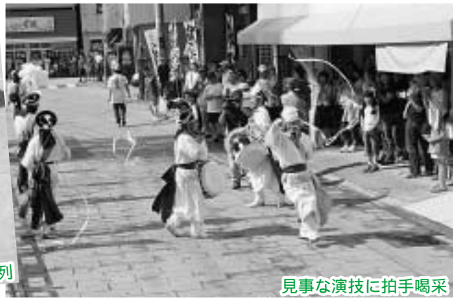
見事な演技に拍手喝采