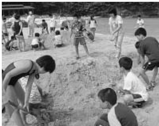
協力して砂の造形にチャレンジ

縁に、平成8年に姉妹提携を結び、これまで様々な交流を行っており、小学生の交流もそのひとつです。