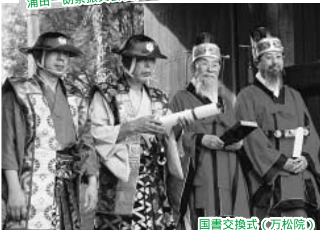
国書交換式(万松院)