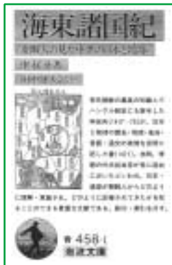
李芸が対日外交交渉で活躍した当時の朝鮮人の見た対馬について詳しく記録された書

李芸は生れたのが一三七三年（日本では南北朝）、母と生き別れたのが八歳の時。対馬に初めて来て抑留されたのが二八歳の時で、本来なら恨むはずの日本人と、誠信の交りを尽くしたところに、この人の偉大さがしのばれる。