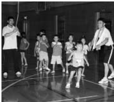
それ今だ！（大なわとびに挑戦）

教室では、同地区の体育指導委員より「ニチレク」、「ドッチビー」、「デイスゲッター9」などのニユースポーツが紹介され、参加した小学生から大人まで気持ちいい汗を流し、みんな楽しんで時間を過ごしました。