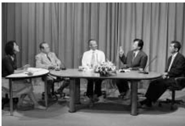
徐々に論議も白熱してきました。

「石井」個人的には娘ばかりで考えられないのですが、自分が親の敷いたレールで対馬に帰ってきて悔しい思いをした。子どもたちにはそうはさせたくない。ただ、対馬からの流出については親の責任が大きい。子どもには良い暮らしをさせたいと思うばかりに島外の学校にやるなど、郷土愛をなくすような育て方をしていると思う。