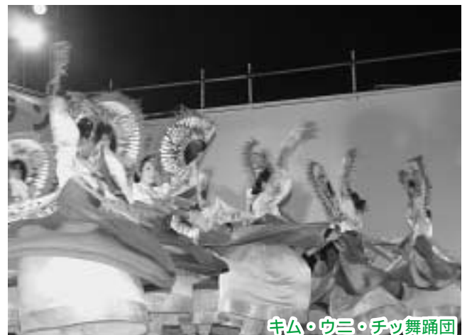
キム・ウニ・チツ舞踊団