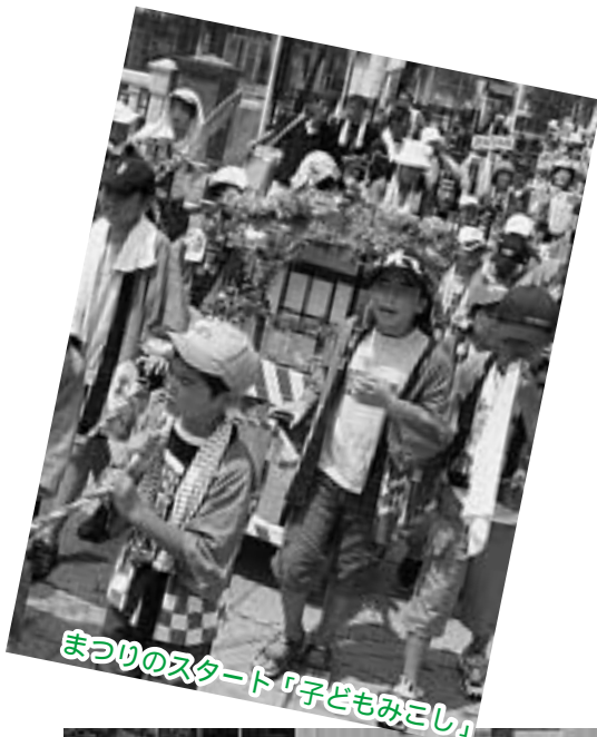
まつりのスタート「子どもみこし」

夜は世界で活躍するキム・ウニ・チツ舞踊団の華麗なステージと柏原芳恵ライブショーで会場は大入り満員になり、祭りは最高潮を迎えました。最後は3000発の花火が夜空を飾り、対馬市最大の祭りが終了しました。