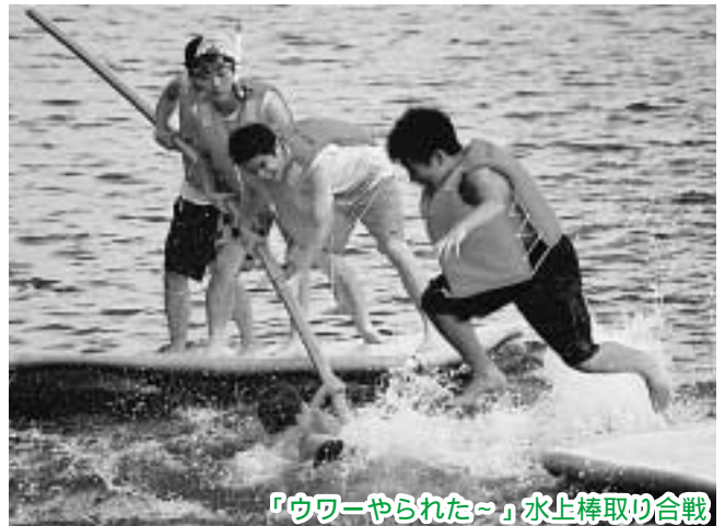
「ウワーやられた〜」水上棒取り合戦