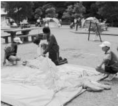
次はどこを組み立てるの？

この研修会は、各地域の子ども会で活動する生徒に、集団生活のあり方と子ども会活動に必要な基礎的能力、技術を身につけてもらうために実施され、テント設営や人権同和講義、キャンプクラフト（竹細工）、野外炊事、ナイトハイキング等を体験し交流を深めました。