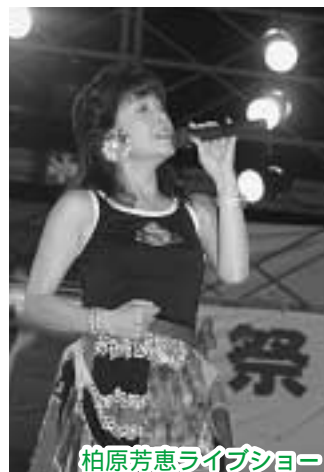
柏原芳恵ライブショー