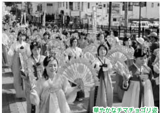
華やかなチマチヨゴリ姿