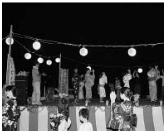
みんなで盆踊りを楽しみました

子供たちに人気のゲームコーナー、大抽選会などお祭りムード満点でした。最後は浴衣を身にまとった人々が盆踊りを楽しんでいました。