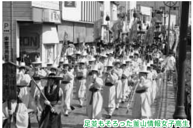
足並もそろった釜山情報女子高生