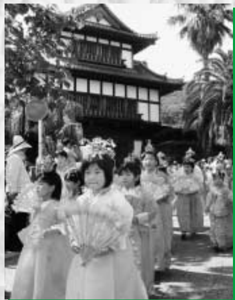
子どもたちもチョゴリを着て行列参加