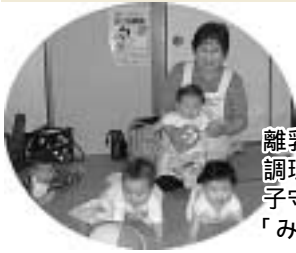
離乳食教室では、調理実習の間、子守りを行います。「みんな良い子ね〜」

その他にも、赤ちゃんのいる家庭へ訪問したり、婦人ガン検診の時は子守りも行っています。現在子育て真っ最中のお父さん・お母さん、あなたの地区の推進員を覚えて頂き、お気軽にご相談下さい。よろしくお願いします。