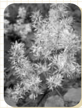
ヒトツバタゴとよく似た木 マルバアオダモ