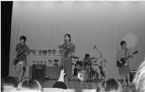
奨励賞のロックグループ