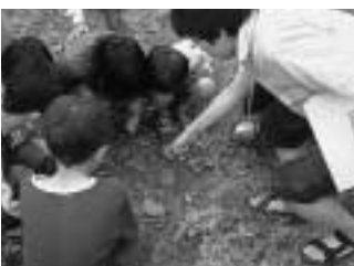
ツシマヤマネコの痕跡を探す子どもたち

あいを楽しんでいたようです。また、田植えが終了した後には、対馬野生生物保護センターの職員が「ヤマネコの痕跡を探せ」と題して、ツシマヤマネコの生態やフンの特徴を説明。子どもたちは、ネズミの骨や稲わらなどが混じったツシマヤマネコのフンを棒で突きながら熱心に観察していました。