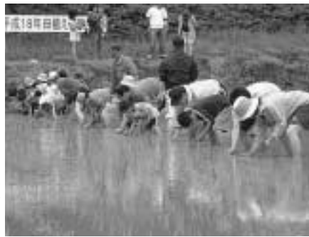
6月4日、上県町佐護の野鳥の森公園で市の農業委員会と認定農業者協議会が主催する「田植え体験」が実施されました。

この事業は、田植えや稲刈り体験をとおして「農業で作業の楽しさ・収穫の喜びを体験する」ことを目的に企画されたもので、市内から約70名の参加者で賑わいました。