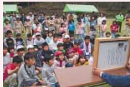
森を題材にした楽しい紙芝居もありました。