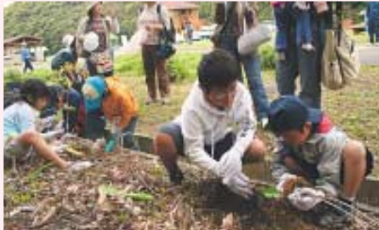
ゲンカイツツジを記念植樹