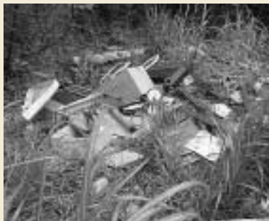
林道横の斜面に不法投棄されたごみ

6月の環境月間にあわせて、不法投棄合同パトロールが実施されました。その結果、山林や道路等に、大量の生活ごみや電化製品等が不法に投棄されたり、放置されたりしていました。不法投棄は、景観を損ねるだけでなく、環境汚染を招くことにもなります。また、廃棄物の「野焼き」は黒煙や悪臭が発生し、近隣に対して大きな迷惑をかけることとなります。