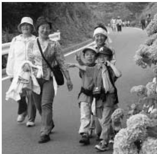
あじさいロードでウォーキングを楽しむ参加者

上県町佐護で恒例のあじさい祭が6月11日に開催され、千歳峠山 せんじゆうまげやま のふもと、海沿いに延びる林道（通称あじさいロード）で、約300名の参加者が道路沿いに咲くあじさいを觀賞しながら、ウォーキングを楽しみました。参加者たちは、初夏のすがすがしい潮風を受けながら、勾配のきつい坂を自分のペースでゆっくりと歩いていました。 また、祭のメイン会場の湊浜シーランドステージでは、コーラの早飲み大会、ピンゴゲーム、対州馬の体験乗馬と共に、島根県より招いた石見神楽 いわみかぐら 、幼稚園児たちのお遊戯、上対馬高校プラスバンド部やアマチュアバンドによる演奏などが披露され、約3000人の来場者を楽しませました。