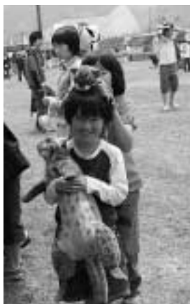
子供に大人気のツシマヤマネコ