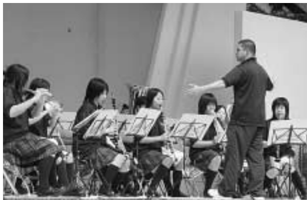
上対馬高校プラスバンド部