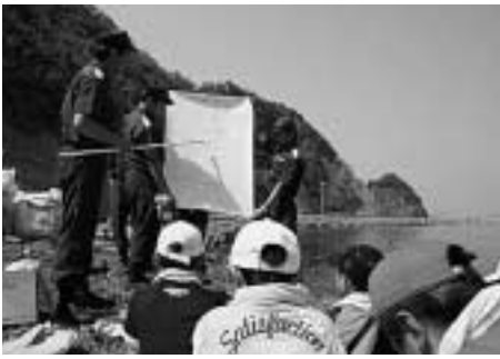
ごみのルートを説明する署員

はじめに署員が海図等を利用して漂着ごみの主なルートや原因等について説明を行い、その後、児童と協力して約400 + グラムの漂着ゴミを回収。集めたごみを手分けして調査を行いました。