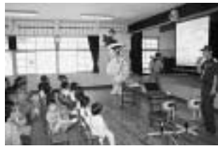
比田勝幼稚園にて