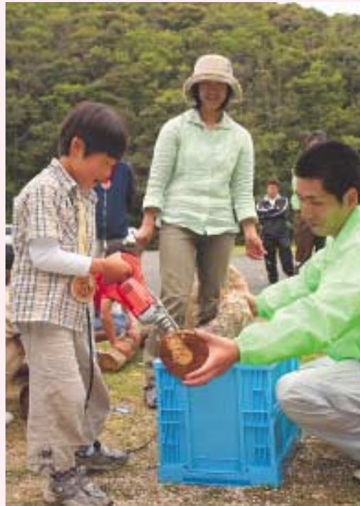
ドリルを使ってしいたけのほだ木にで穴を開ける子ども