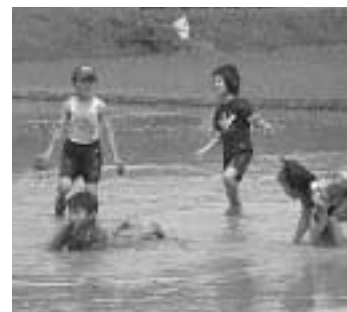
やっぱり泥んこになりました。

当日は天気にも恵まれ、元氣よく田んぼに飛び込んだ子どもたちは、泥んこになって歓声をあげながら田植えをしていました。スタッフの丁寧な指導で農業や自然とふれあう楽しさを学び、親子のふれ