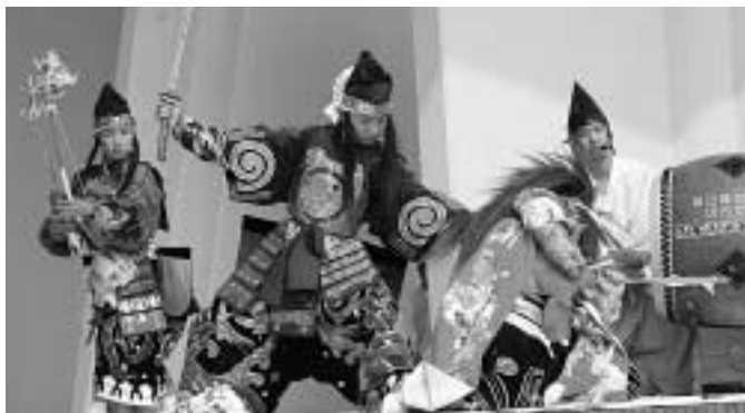
迫力ある演技で、場内を盛り上げた石見神楽