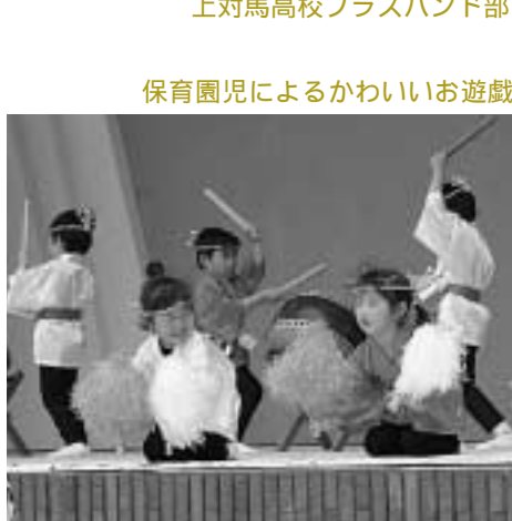
保育園児によるかわいいお遊戯