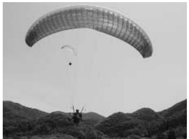
着陸態勢に入ったパラグライダー

からテイクオフし、1km程先のランディングポイントへの着陸の正確さを競いました。風の強さや風向が安定せず競技には難しい条件となった大会初日でしたが、コンディションが回復した隙間をぬって33名の選手が計55本のフライトを行いました。 選手たちは、風を受けて大空に舞あがるパラグライダーを巧みな操作で操り、目標の着陸地点へ向けてしばしの空中散歩を楽しんでいました。残念なことに大会二日目は