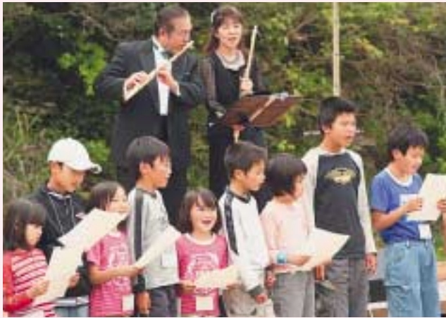
フルートの伴奏に合わせて合唱する子どもたち 森のミニコンサートにて