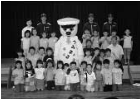
うみまると記念撮影する園児たち