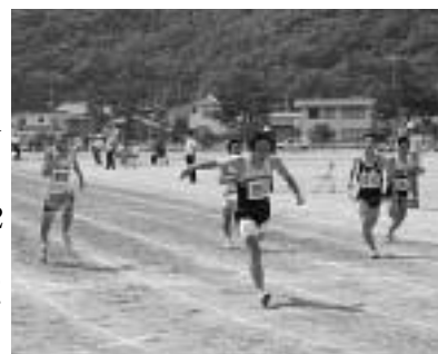
3年男子100m決勝の様子