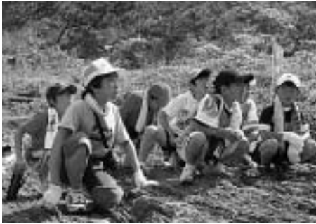
参加した久原小学校の児童たち

園児84名に、海上保安庁のキャラクター「うみまる」が登場する環境紙芝居の上演やごみを海や川に捨てないように呼び掛ける環境クイズを実施しました。