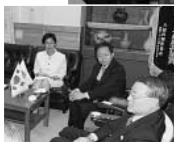
キムヨンソ 金榮昭福岡総領事（中央）と大使婦人（左）

6月9日、韓国の羅鍾一駐日大使夫妻と、金榮昭福岡総領事ら4名が対馬市役所を表敬訪問し、松村市長と会談を行いました。