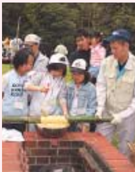
バームクーヘン作りに挑戦する参加者