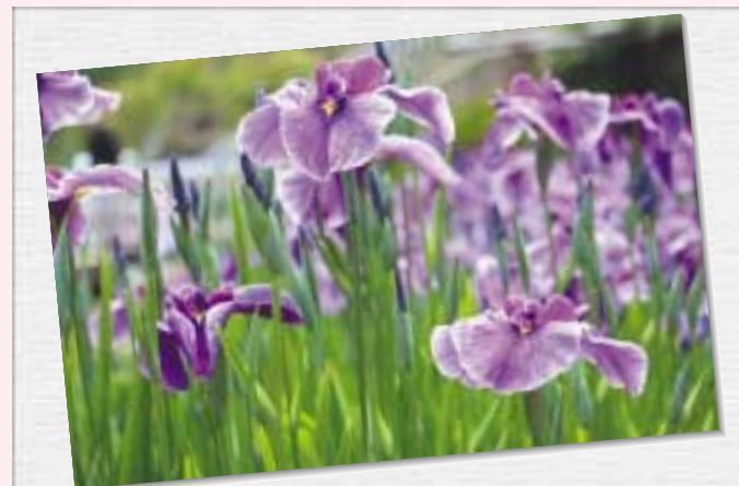
紫に染まる菖蒲 しょうぶ の花（6月7日グリーンパークで撮影）

美津島総合公園（グリーンパーク）の池の周りにたくさんの菖蒲の花が咲いていました。紫と白のとても美しい花です。来年はこの時期にあわせて家族でお出かけになってはいかがでしょうか？