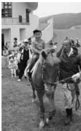
対州馬に乗る子供