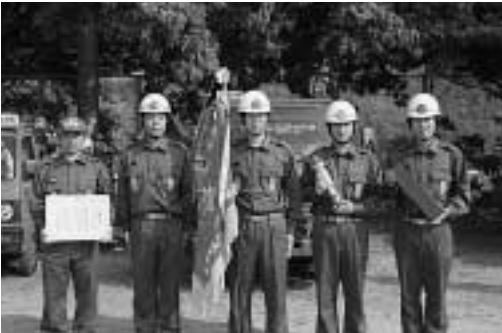
小型ポンプ操法の部：優勝 美津島第10分団