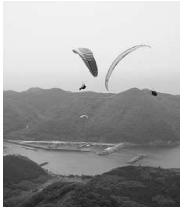
対馬の空を華やかに彩るパラグライダー

対馬の美しい山並みと青く輝く海を眺めながら、標高約280mの千俵峠山の山頂から舞い上がる色とりどりのパラグライダー 今回で4回を数えるパラグライダーディング対馬大会が6月10日・11日の2日間、上県町佐護の千俵峠山を舞台に開催されました。 大会には韓国から9名と長崎、大分、福岡から29名、また、地元で活動しているスカイクラブ対馬のメンバー7名の計45名がエントリー。山頂