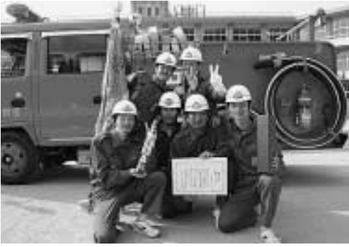
ポンプ車操法の部：優勝 美津島第1分団