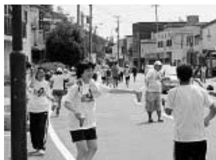
飲料水を差し出すボランティア