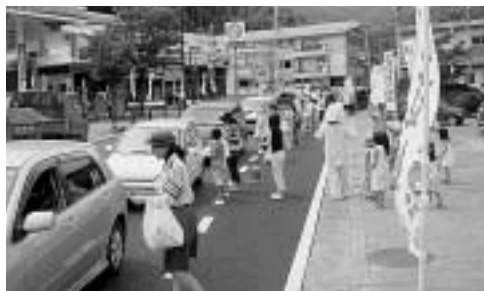
7/15 さわやか作戦(厳原町棧原)

「夏の交通安全県民運動」が7月10日から19日までの10日間にわたり展開されました。市内の各地では、交通安全協会や母の会などによる「さわやか作戦」や交通安全パレードなどが実施され、ドライバーに安全運転を呼び掛けました。