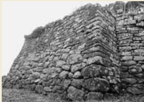
金田城跡(国指定・特別史跡)

この機会をぜひ活用していただき、毎号紹介する「文化財」の実物を現地で見ていただけたなら幸いです。