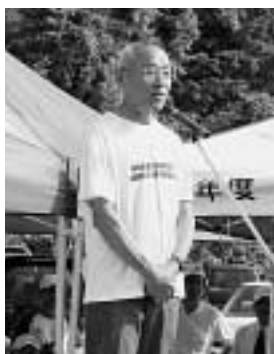
メキシコ五輪で銀メダルを獲得した君原健二さんも大会に参加しました。