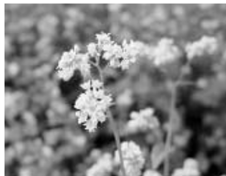
播種：作物の種子をまくこと

4. 景観作物としての利活用 秋の開花期は一面が白く染まり、人々の目を惹きつけます。対馬の風物詩として景観作物的な効果も期待できます。栽培面積の拡大をお願いします。