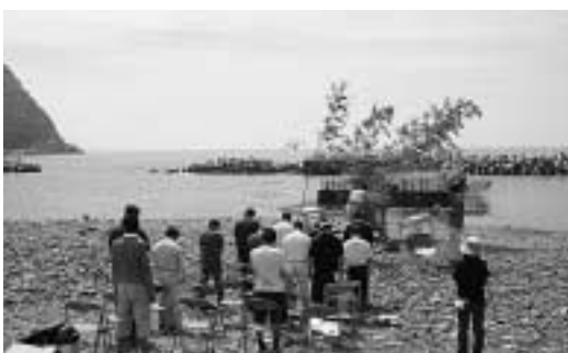
尾浦海水浴場での安全祈願の様子