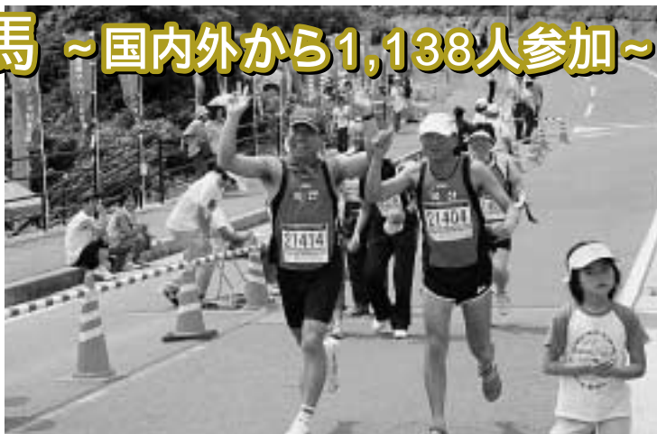
笑顔でゴールする参加者

毎年雨に見舞われることの多いこの大会ですが、今年は晴天に恵まれ、ランナー達は初夏の気持ちよい潮風を体を感じながら、自分にあったペースで国境の町を駆け抜けていました。