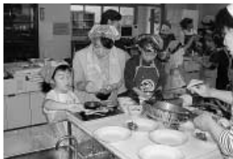
家族料理教室の様子