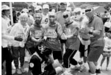
奇抜なコスチュームで楽しませてくれるのも、この大会ならではの