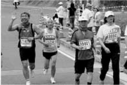
晴天に恵まれた今年の大会 ゴールするランナーたち

今年の国境マラソン(7月2日)には、皆さんびっくりしませんでしたか。 釜山事務所ができて4年目、国境マラソンに通訳ボランティアとして参加したのは3回目ですが、ご存じの通りここ3年間、大会当日は雨が台風でした。相変わらず今年も前日は雨だったので、てっきり明日も雨だろうと思いこんだまま寝ました。しかし、目が覚めた時、まぶしい朝日にびっくりしてしまいました。 いい天気恵まれて、韓国から参加した82名を含む選手の皆さんが気持ちよく対馬を走られたようです。「国境マラソン I N 対馬」と交流している KNN(釜山・慶南放送局)「環境マラソン」のハーフで優勝し対馬に招待された選手も、男子はハーフで2位、女子はハーフで1位という好成績をあげました。この二人は、沿道からの市民の熱い声援のおかげだったとお礼を言っていました。そしてさらに、「高低の差が激しいコースで多少きつかったのですが、こんなきれいな自然の中を走ったのは本当に久々のことで、一緒に練習している仲間たちにも紹介し、ぜひ国境マラソンと対馬の自然を体験してもらいたい」と感想を述べていました。来年の大会がいまから待ち遠しいです。