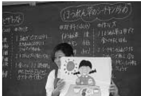
ヘルスマイトが紙芝居でお話し