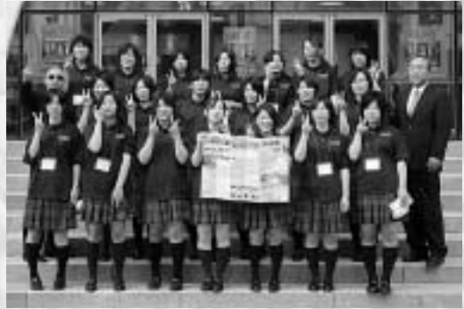
上対馬高校プラスバンド部のメンバーたち

上対馬高校のプラスバンド部が、5年連続で釜山管楽祭(7月7日)に参加しました。 到着した日はホテルにチェックインした後すぐに合同演奏することが決まっていたデヤン電子情報高校へ訪問しました。毎年行われる合同演奏は、前もって決めていた演奏曲をお互いに練習しておき、管楽祭の前日または当日の午前に演奏合わせをした後、本番で披露するものです。 上対馬高校は20名、デヤン高校は46名。初めて日本の学校と演奏するデヤンの高校生の間に緊張感が広がります。2時間もあった練習時間もあっという間に過ぎてしまいました。 釜山管楽祭の当日。舞台でのリハーサルを終えて、本番前の合間を縫って、会場となる釜山市民会館の周りで対馬の観光パンフレットを配り、対馬をPRしました。