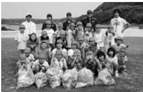
比田勝小学校4年生のみなさん

7月4日と7日、比田勝海上保安署による海洋環境教室及び漂着ごみ調査が実施され、比田勝小学校4年生の生徒27名が参加しました。