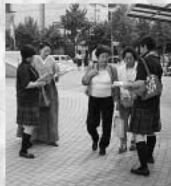
観光パンフレットを配る生徒たち