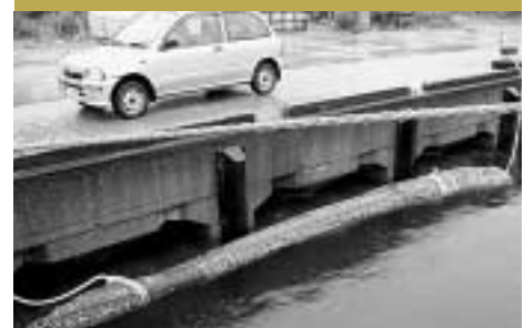
女護島沖で発見された流木:長さ8m、直径最大部分1m