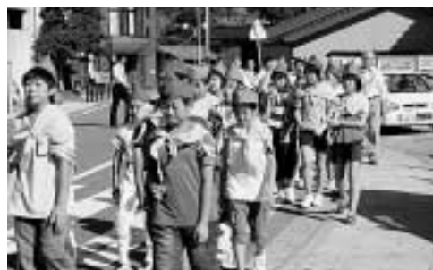
7/13 交通安全パレード(豊玉町仁位)