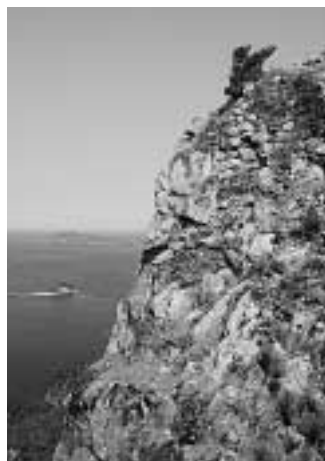
頂上(石塁)と浅茅湾

今からおよそ1300年以上も昔、西 暦663年(天智2)大和朝廷は友好関 係にあった朝鮮半島の「百濟」復興の ため大軍を派遣し、「唐」・「新羅」と 白村江で戦いましたが大敗しました。 その結果、国内の防備を固め来襲に備 える必要が生じました。敗戦の翌年 に對馬・壹岐・筑紫に「防人」と「烽」 を配置し、また、西日本各地に山城を 築き防備を固めました。