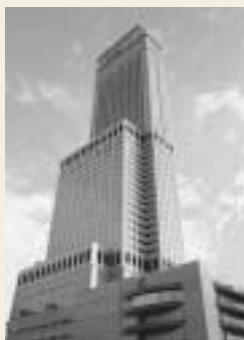
全日空ゲートタワーホテル大阪

「長崎対馬フェア」 開催期間 2月1日~3月15日 開催店舗 中国料理「花梨」(54階)、鉄板焼「りんくう」(52階)、テラスレストラン「カフェ・イン・ザ・パーク」(2階)、日本料理「雲海」(52階) 大阪府泉佐野市りんくう往来北1番地 072(460)1111