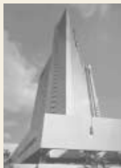
東京全日空ホテル

「長崎県 対馬フェア」 開催期間 3月1日~3月31日 開催店舗 チャコールキッチン炙(3階) 東京都港区赤坂1丁目12番33号 03(3505)1111