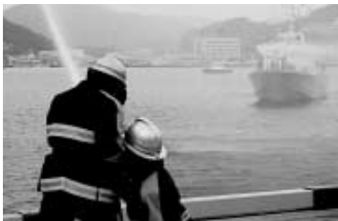
陸上と海上からの放水訓練の様子