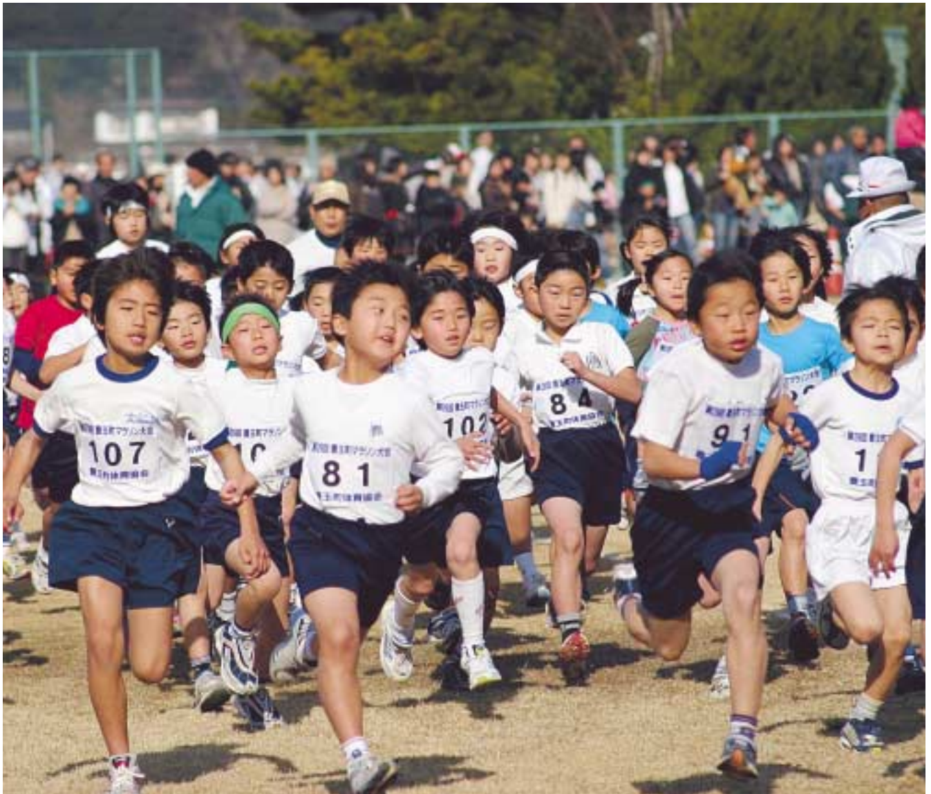
トップ目指して一斉スタート!! 第29回 豊玉町マラソン大会 (2/4)