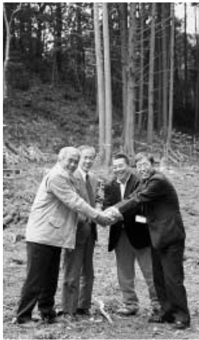
取り組みが始まる森でガッチリ握手する関係者

ボランティアグループ「ツシマヤマメコ応援団」と上対馬町舟志地区、住友大阪セメント株及び対馬市は、2月16日、「舟志の森づくり推進委員会」を発足させました。絶滅の危機にあるツシマヤマメコを中心とした野生生物の保護と、人と自然が共生するモデル林をつくることを目的です。