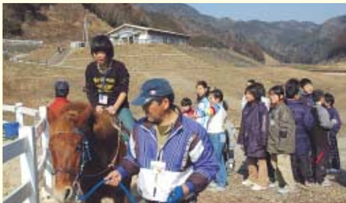
対州馬と楽しくふれ合う子どもたち