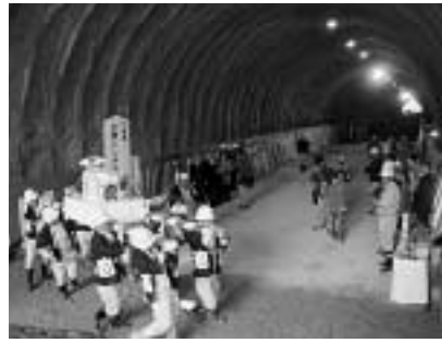
トンネル内部で行われた貫通式

昨年の10月から掘削が進められてきた市道と板系瀬線（豊玉町）の志賀トンネルが貫通し、2月5日現地で貫通式が行われました。