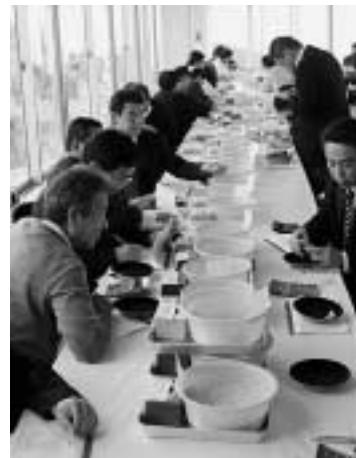
緊張感ただよう入礼会場

品質の良さで全国的に定評のある対馬産真珠の第1回入礼会が1月27日～29日、対馬真珠養殖漁協（巖原町）で行われ、島内で生産された1級品の真珠332点、80貫710匁（約303kg）が出品されました。