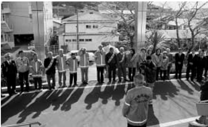
市役所玄関前での記念セレモニー

2月26日、対馬南地区交通安全協会は、対馬南警察署管内の交通死亡事故「ゼロ」記録が2月23日をもって1,000日を達成したことを祝い、市役所正面玄関前で記念セレモニーを行いました。