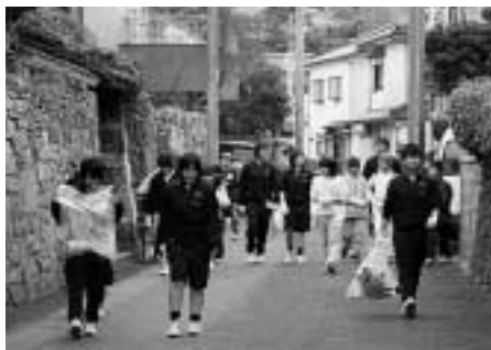
中村地区を清掃する子どもたち

地域清掃活動に取り組んでいる県立対馬高校が厳原小学校と連携して、2月13日、厳原市街の道路や万松院などの観光地などを清掃しました。異なる世代との交流を通して心の教育の充実を図ろうと実施されたものです。