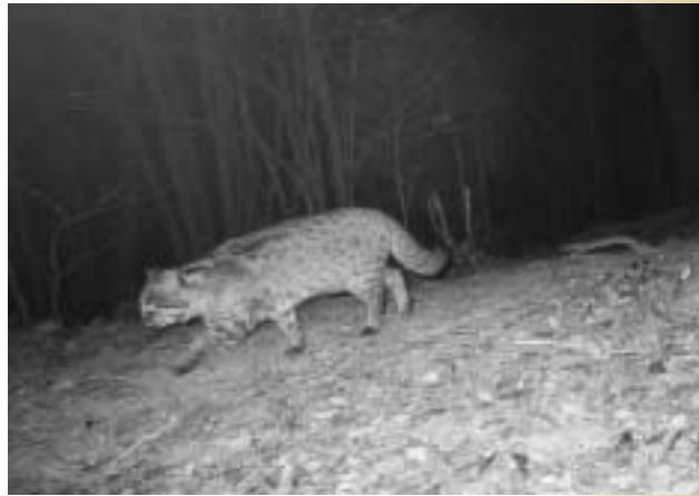
自動撮影カメラに納められたツシマヤマネコの画像