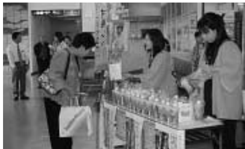
空港ロビーで無料配布された乾しいたけの入った「もどしポット」。容器の中でしいたけが戻せるほか、もどし液が利用しやすくしてある優れたものです。