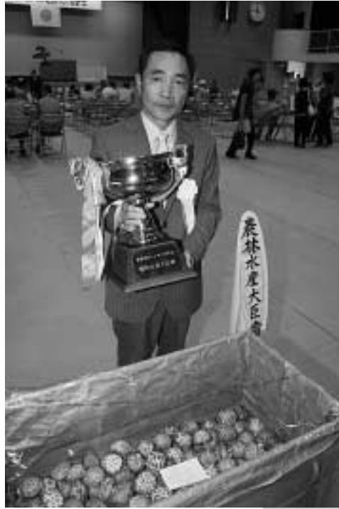
農林水産大臣賞を受賞した乾しいたけ(香信厚肉:箱物)

5月20日、上県町佐須奈の上県体育館で、長崎県乾しいたけ品評会(長崎県しいたけ振興対策協議会主催)が開催されました。