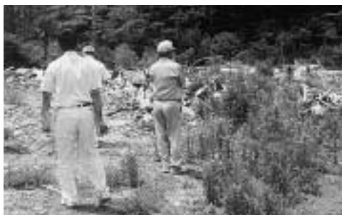
野積みされた廃材など

6月の環境月間にあわせ、対馬市、対馬保健所、警察署、長崎県産業廃棄物協会对馬吉岐支部など関係者による不法投棄パトロールを実施しました。今回のパトロールで目立ったケースとして