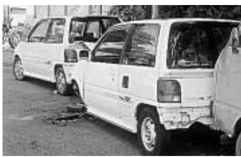
不法に放置された車