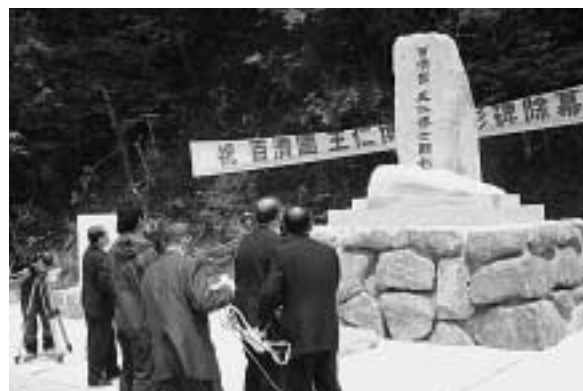
顕彰碑の除幕を行う日韓の関係者