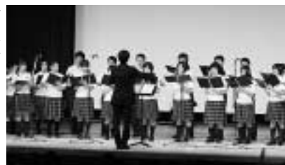
対馬高校コーラス部