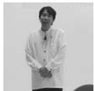
人権一人芝居「もも子」

【問い合わせ先】 対馬市教育委員会 学校教育課 0920(86)3212 FAX 0920(86)4433