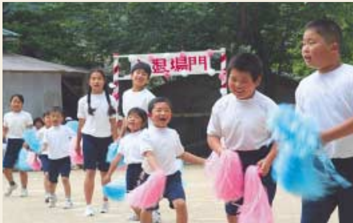
全校児童で紅白応援