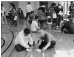
紙飛行機を作る選手たち

フライトができず残念な結果となった大会でしたが、選手達は久しぶりに顔を合わせた他のクラブのメンバーと交流会等で楽しい時間を過ごし、来年の再会とフライトを誓っていました。