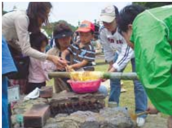
竹を使ったバームクーヘン作り

6月3日、豊玉町の神話の里自然公園で、第2回『新緑のつどいinつしま』が開催され、子どもたちをはじめ約300名の市民が参加しました。