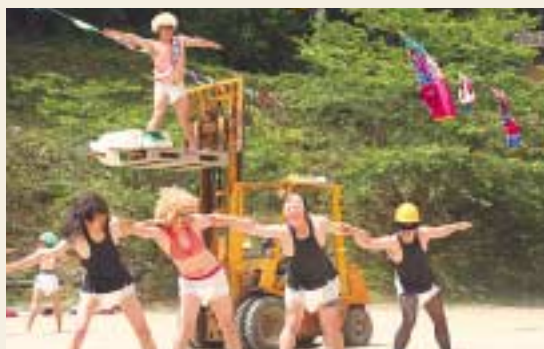
青年団による楽しいパフォーマンス