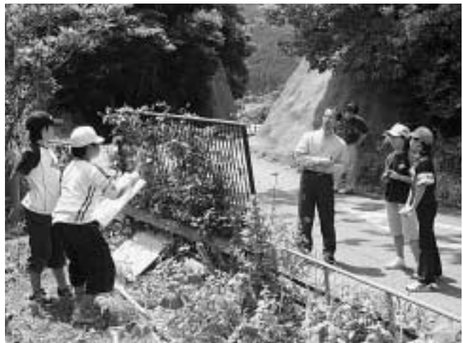
教授の指導で危険な場所を確認する児童たち