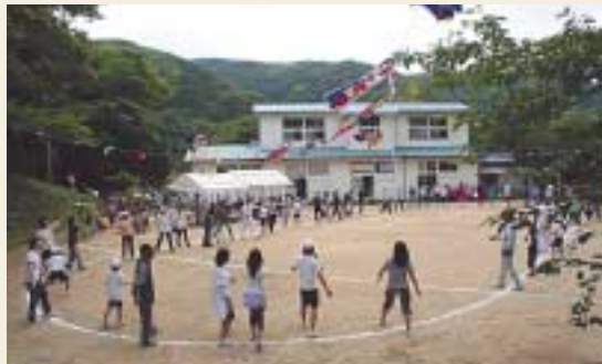
地域の人も参加した「対馬音頭」

5月に入り、市内各地の小学校で春の運動会が開催され、校庭には児童たちの明るい笑顔が溢れました。