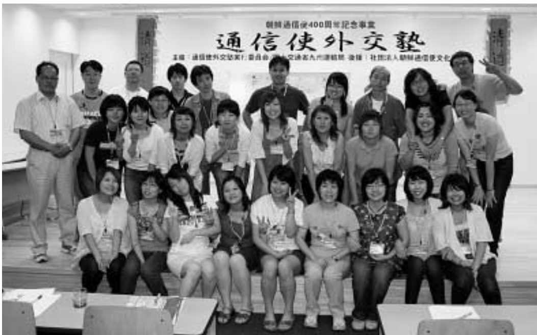
朝鮮通信使が来日して400周年を迎える今年、外交の重要な舞台となった対馬に日韓の若者が集い、その歴史と外交精神を学び、今後の国際交流のあり方について考える「通信使外交塾」が、7月20日～23日まで開かれました。