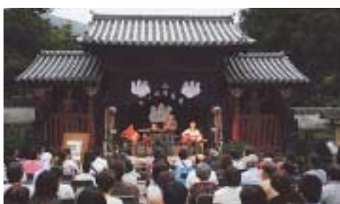
正門で開かれた音楽祭

また、今年は特別企画として正門を舞台に音楽祭が開かれ、地元のバンドの演奏をはじめ、邦楽や筑紫舞などが披露され、来場者を楽しませていました。