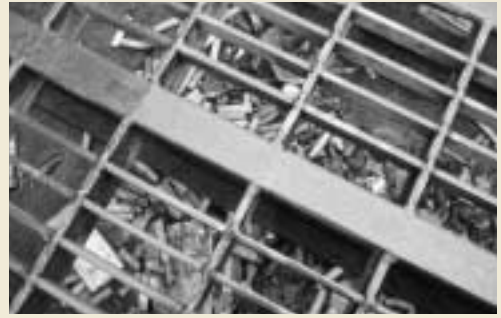
側溝に集まった大量の煙草の吸い殻

また、路上で捨てられたごみは、側溝に集まります。写真では、煙草の吸殻、フィルターが目立ちます。このようにポイ捨てされたごみの多くは、川を通り海に流れていきます。多くの大人が吸殻と一緒にマネーも捨てているのでしょうか？