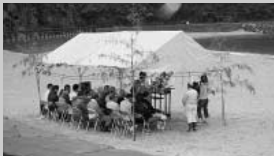
美津島海水浴場(勝見浦)の海開きの様子