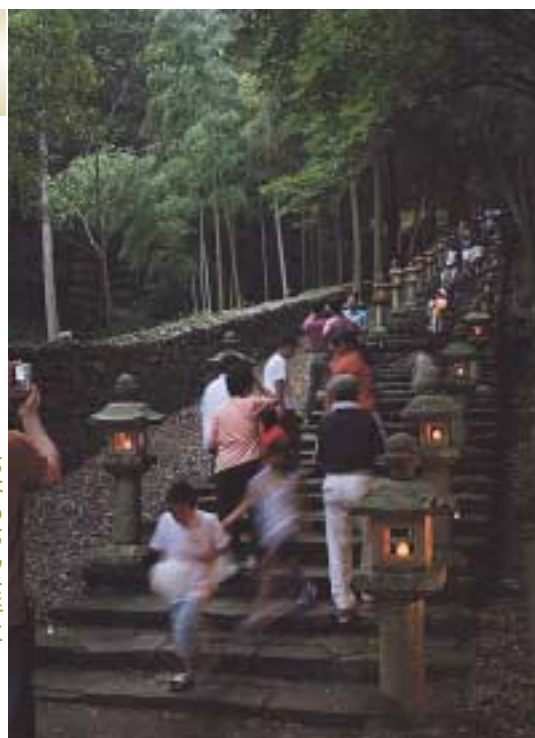
ちょうちんを手に 百雁木を登る来場者