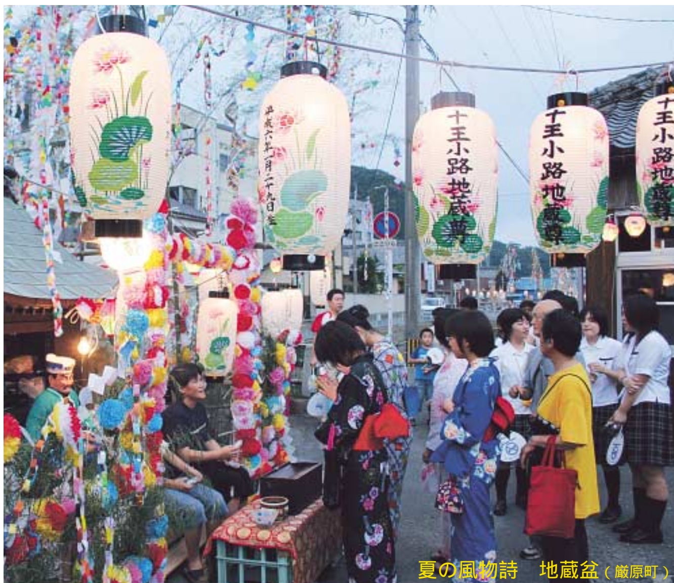
夏の風物詩 地蔵盆（巖原町）

7月24日、巖原町で恒例の地蔵盆が行われ、浴衣に着替えた子どもたちや家族連れが、飾り付けられた地区内のお地蔵さんを巡り、手を合わせていました。