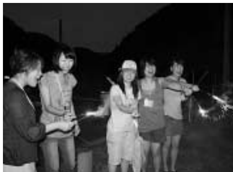
花火を楽しむ塾生たち

津島町の勝見浦で海水浴を体験。島外からの参加者は、その透き通った海水や美しい砂浜に感動していた様子でした。韓国からの参加者の中には、海で泳ぐことが初めてという人もいて、感激した様子でした。泳いだ後の海岸では、バーベキューや花火で楽しいひとときを過ごしました。