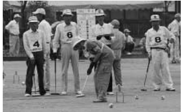
競技に励む選手のみなさん

7月20日、対馬市豊玉ゲートボール場（豊玉町仁位）で、第24回対馬・壱岐親善ゲートボール大会（長崎県ゲートボール協会主催）が開かれ、対馬から36チーム、壱岐から12チームの合わせて48チーム、総勢約290名の選手たちが参加し、ゲームを通じて親睦を深めました。