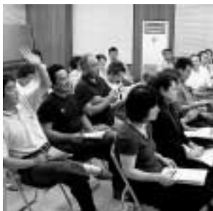
参加した保護者の皆さん

佐護小中学校の教育週間中の活動はホームページ（ http://www5.ocn.ne.jp/~sago/top.html ）にも掲載されていますので、ぜひご覧ください。