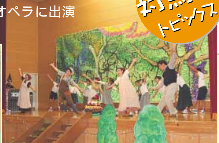
「おんともくらぶ」とオペラに出演した金田小の皆さん

7月11日、厳原町の金田小学校（全校児童36名）体育館でオペラ「ヘンゼルとグレーテル」が上演され、同校の3、4年生児童9名が長崎市から来たグループ「おんともくらぶ」のメンバー6名と共に舞台上に立ちました。この公演は、子どもたちの芸術への関心を高めてもらおうと文化庁が行っている「学校への芸術家等派遣事業」の一環で行われたものです。