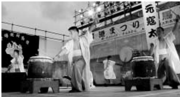
陸上自衛隊対馬警備隊による元寇太鼓