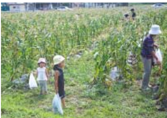
収穫を楽しむ皆さん

また、会場に設けられた試食コーナーや、同公社で栽培されたブルーベリーの販売も人気を集めていました。