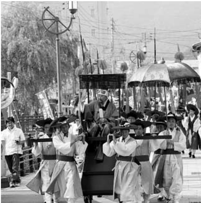
川端通りを進む通信使行列

りました。 会場には夏休み真っ最中の子どもたちをはじめ、家族連れや帰省客、国内や韓国からの観光客など大勢の人々で賑わい、夏のイベントを楽しみました。 まつりの最後には、約3000発の花火が打ち上げられ、厳原港の夜空に鮮やかな大輪の花を咲かせました。