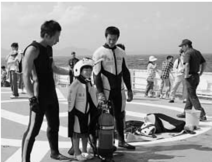
船上で潜水士の装備を体験する子ども気分は「海猿」ってところですね

当日は少し時化ていましたが、海上で実施された巡視艇3艇とヘリコプターによる迫力ある訓練や、船内の装備の見学、海上保安庁のキャラクター「うみまるくん」との記念撮影などを楽しんでいました。