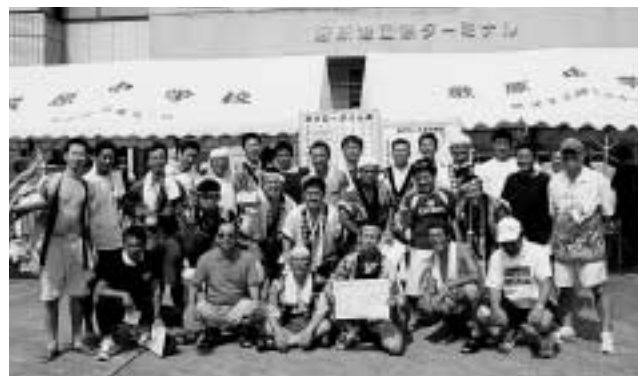
優勝した海上自衛隊チームの皆さん

凝った衣装のあやきりが音頭をとって進む舟グローに、応援に来た家族から声援が飛んでいました。結果は、1位 海上自衛隊、2位 ㈱九電工、3位 陸上自衛隊