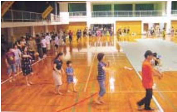
佐須奈湾沿いに灯された竹灯籠 盆踊りを楽しむ来場者