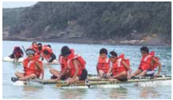
手作りいかだで遊ぶ子どもたち

3日間行われた交流では、地元育成会のグラウンドゴルフ大会への参加や三宇田浜での海水浴をはじめ、いかだ作りやシーカヤック体験、バーベキューなどを行い子ども同士の友達の輪を広げました。