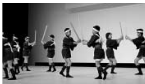
卯麦の盆踊り(豊玉小学校児童盆踊り保存会【豊玉】)