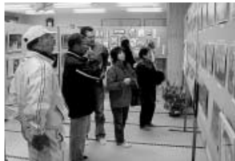
展示写真に見入る人々

地域に元気を取り戻そうと区民が日頃から趣味として取り組んでいる盆栽、写真、工芸品などを持ち寄った手作りの文化展です。 中には檜漕ぎ舟による朝鮮海峡横断の記録や昔の捕鯨施設の写真等、地元ならではの貴重な展示物も見られ、2日間200名を超える来場者で賑わいました。