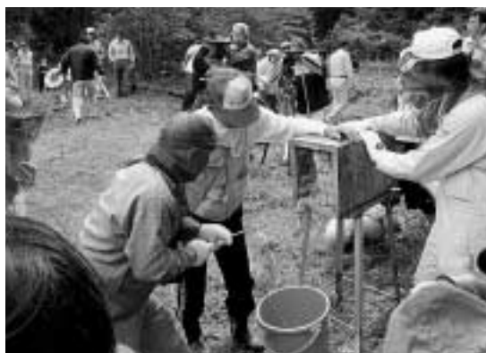
蜂洞から採蜜する参加者

無数の蜂が飛び交う中での作業でしたが、参加者は怖がる様子もなく養蜂農家の手を借りながら採蜜作業を楽しんでいました。