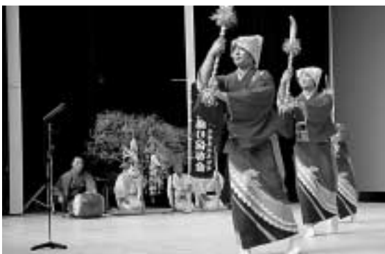
上里の盆踊り(上里郷土芸能保存会【峰】)

11月25日、対馬市交流センターで第17回対馬郷土芸能発表大会が開かれ、各地に伝承されている盆踊りや民謡などの貴重な郷土芸能が披露されました。この催しは、美しい自然と伝統に培われ先祖代々受け継がれてきた対馬の郷土芸能を大切に、後生に伝えていこうと対馬島郷土芸能保存会が毎年主催しているのです。