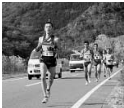
佐須地区を走る選手たち