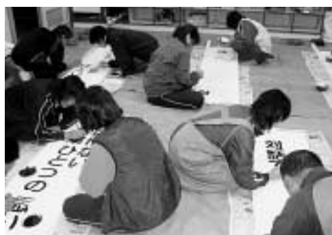
人権標語の看板を製作する様子（上）