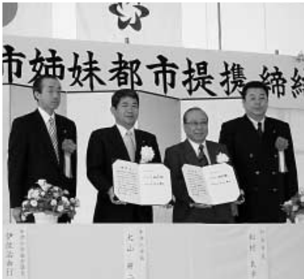
姉妹都市の提携書を持つ両市の市長