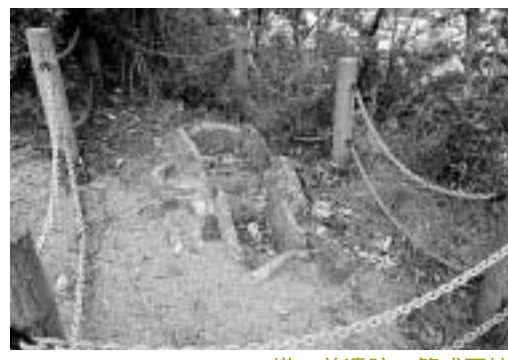
塔の首遺跡の箱式石棺

上対馬町の比田勝市街をぬけると古里にいたります。古里川を渡ると西側に小高い丘があり、頂上に塔の首遺跡があります。この遺跡は今から約1900年前(弥生時代後期)に築かれた墓で、現在は3基の箱式石棺からなっています。 箱式石棺とは数枚の平たい石を地面に立てて、長方形の箱形に組んだ棺のことです。遺跡の中で最も大きい箱式石棺は長さ約180センチ、幅