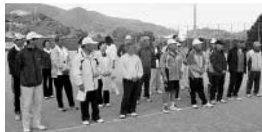
交流試合に参加した日韓の選手たち

両団体は平成15年から対馬と慶州を行き来しながら交流を続けており、交流試合は今回で5回目。対馬での開催は3回目となります。個人戦では優勝を譲ったものの、団体戦では3対2で対馬ソフトテニス連盟が勝利しました。