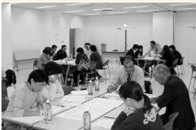
厳原地区座談会の様子(対馬市交流センターで)

対馬市では、市民の皆さんが住み慣れた対馬で安心して快適に暮らせるように、福祉サービスの充実や、市民が進んで参加できる地域活動を進めることを目的に、地域福祉計画を策定しています。