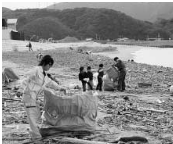
小茂田浜での清掃活動の様子

対馬市の環境美化と自然保護を目的に設立された「環境NPO法人 対馬の底力」が、11月4日、第1回目の清掃活動として厳原町の小茂田と椎根で海岸清掃を行いました。