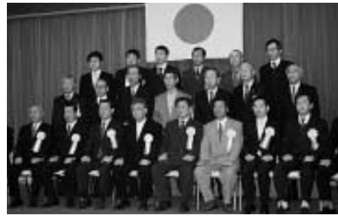
前列が表彰された方々(左から4人目は税務署長)

平成19年度の税務署長納税表彰及び感謝状贈呈式が11月14日、厳原町で開催され、多年にわたる申告納税制度の普及、発展並びに納税思想の向上に功績をあげたとして、厳原税務署長より6名に対し表彰状、感謝状が贈られました。(敬称略)