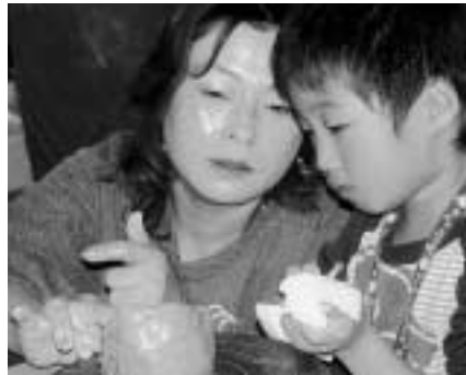
いいのはできたかな？ 11月3、4日に上県地区公民館で開催された上県町文化まつりで、陶芸を体験する参加者