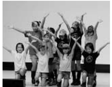
11月4日に対馬市交流センターで開催された厳原町文化まつりで、ダンスを発表するミュージックスクールの子どもたち

地域に元気を取り戻そうと区民が日頃から趣味として取り組んでいる盆栽、写真、工芸品などを持ち寄った手作りの文化展です。 中には檜漕ぎ舟による朝鮮海峡横断の記録や昔の捕鯨施設の写真等、地元ならではの貴重な展示物も見られ、2日間200名を超える来場者で賑わいました。