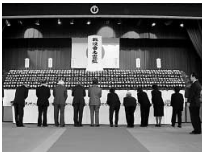
祭壇へ菊の花を手向ける遺族の皆さん