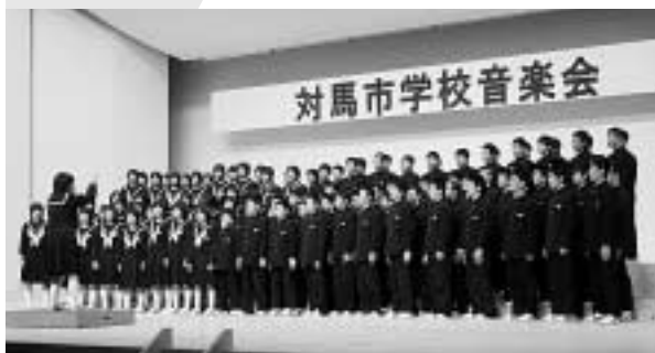
合唱を発表する久田中学校生徒

厳原町内の小・中学校の児童・生徒が集まって開かれる対馬市学校音楽会が11月15日、対馬市交流センターで開催されました。午前は小学生の部、午後は中学生の部が開かれ、児童・生徒が合奏や合唱を発表しました。ホールには、この日のために練習を積んできた子どもたちの澄んだ声や楽器の音が響きわたり、会場に足を運んだ多くの保護者や地域の人々が熱演を温かく見守っていました。