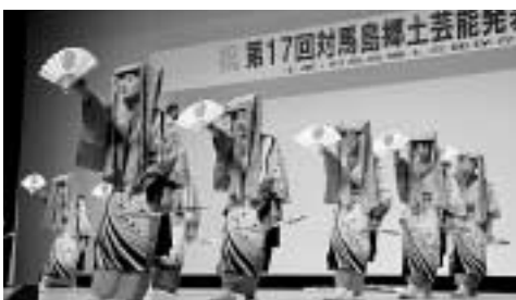
曲の盆踊り(曲郷土芸能保存会【厳原】)

練習を積み重ねてきた出演者たちによる郷土愛こもった熱演に、観客は盛大な拍手を送り、遠い昔の先人たちの生活に思いを馳せているようでした。