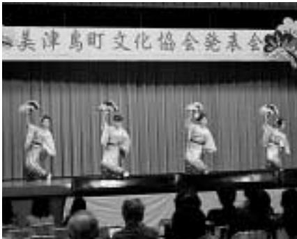
11月3日、美津島町体育館で開催された第4回みつしま町文化まつりでは、舞踊や詩吟などの演目が披露され、大きな拍手が送られていました。

11月3日は文化の日。市内の各地区では文化まつりが開催され、日頃文化活動に取り組んでいる方々の絵画、書、生け花、手工芸、写真、洋裁などの作品を持ち寄った展示会や、舞踊、詩吟、コーラス、ダンスなどの発表会が開かれ、芸術の秋を彩りました。