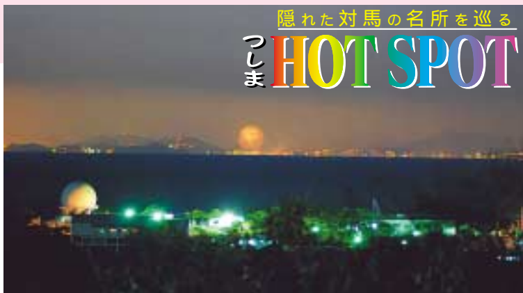
10月20日、上対馬町鰐浦の韓国展望所から撮影した釜山市(中央の丸い光は、釜山市で開かれた花火大会での花火です)

韓国まで49・5 km 対馬から韓国釜山市まではわずか49・5 km。この距離の地は2箇所あることをご存知でしょうか。 ひとつは、「対馬最北端の地」上対馬町鰐浦です。ここには地理的・歴史的にも深い関係にある韓国の古代建築様式を取り入れた韓国展望所があります。また、元禄16年旧暦2月5日朝、釜山から対馬に向け出発した訳官使船