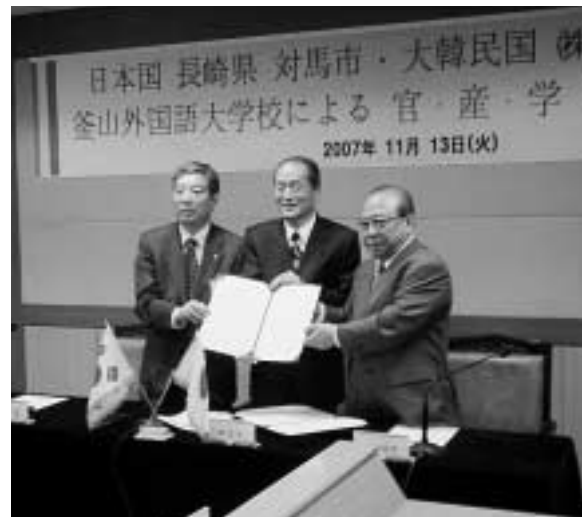
協定書を手にする各団体の代表者

調印式は、11月12日に釜山外国語大学校で行われ、対馬市長をはじめ各団体の代表者が協定書に調印し、今後のさらなる交流発展と協力を誓いました。