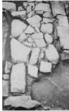
コフノサエ遺跡11号墳墓