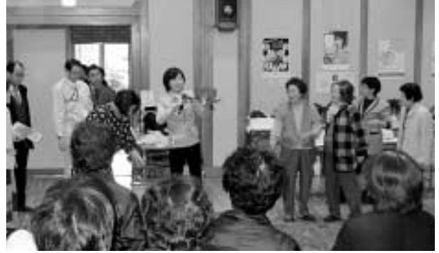
コンテスト風景 約120名の観客で賑わいました