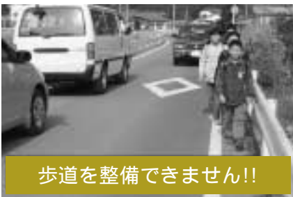
歩道を整備できません!!