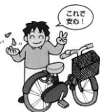
平成19年中 主な窃盗被害の施錠状況