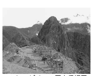
マチュ・ピチュの歴史保護区