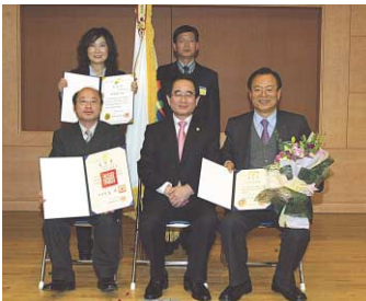
地方行政革新評価で大統領賞受賞 (前列右側が影島区庁長)

対馬市と姉妹縁組を締結している釜山広域市影島区からのお便りです。 「全国地方自治体のうち最高点を獲得」