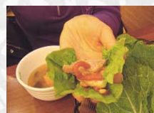
①豚肉をサンチュで包んで

あっさりした豚肉に、野菜やごま油風味の味付け味噌の香りが口中に広がります。しかも豚肉は栄養素が多くコラーゲンも豊富。おいしくて、美容にもいい一石二鳥の料理ですよ。ぜひ作ってみてください。