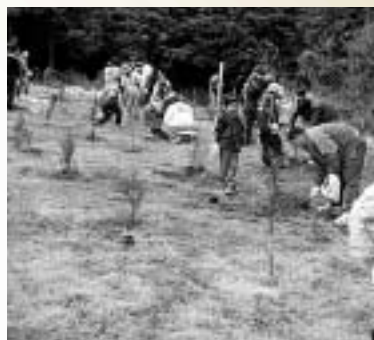
ボランティアによる植林