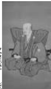
陶山訥庵先生肖像