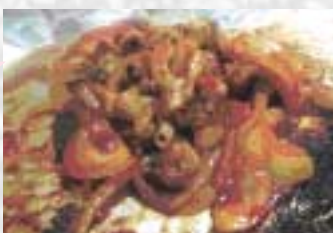
日本ではあまり食べないけど韓国では大人気!

たくさんの野菜とコチュジャンの味付けタレとともに、鉄板で焼いて食べます。又タウナギは肌がいい美容食品として人気があり、町のいたるところで、又タウナギ専門店を見ることができます。