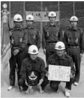
ポンプ車操法で優勝した 豊玉第1分団(仁位)

大会には、各町からポンプ車の部に6分団、小型ポンプの部に10分団が参加。仕事の傍ら夜間に厳しい練習を繰り返してきた選手達は、その成果を発揮しようと全力で競技していました。各種目で優勝した分団は、8月3日に大村市で行われる県大会に出場予定です。