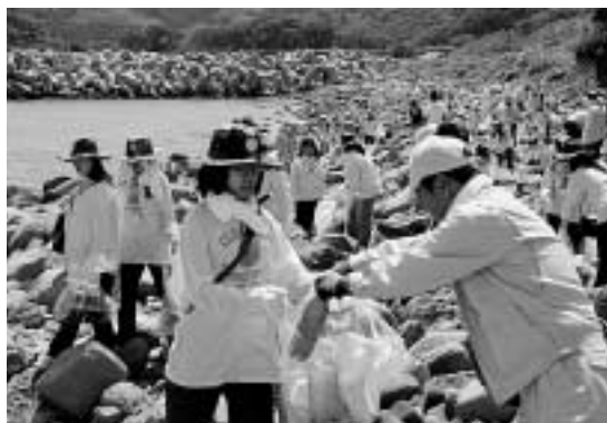
協力してゴミ回収を行う日韓の参加者（田ノ浜）

釜山外国語大学の学生が対馬市民と協力して漂着ゴミの回収を行う日韓市民ビーチクリーンアップが、5月31日と6月1日の2日間、上県町の田ノ浜と佐護湊の海岸で実施されました。清掃活動には93名の大学生と、島内各地から市民ボランティア（初日202名、2日目177名）が参加。日韓合わせて2日間で延べ565名が作業にあたりました。