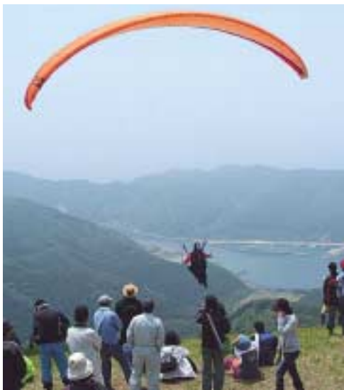
山頂から離陸するパラグライダー