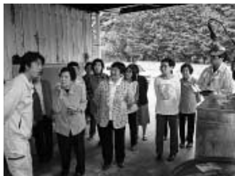
リサイクル施設で説明を受ける食生活改善推進協議会厳原支部の皆さん。同会による回収作業は、7月から開始の予定です。

環境の保全や対馬の美しい自然の保護にもつながっていくことでしょうか。同様の活動は、対馬市食生活改善推進協議会厳原支部でも計画されていて、回収活動での注意点を明確にしようとして5月19日に美津島町のリサイクル施設の視察を行いました。このように、地域循環型エネルギーの有効活用の機運が市民の間で高まっています。