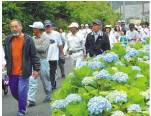
あじさいロードでウォーキングを楽しむ参加者

メイン会場では、対州馬の乗馬体験をはじめ、上対馬高校プラスバンド部の演奏や保育園児のお遊戯、コーラの早飲み大会などが催され、また、未公開の場所を見学できるヤマネコセンター・棹崎灯台ツアーなどもあり、参加者は楽しい一日を過ごしていました。