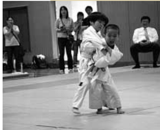
第1回対馬市長杯少年柔道大会

6月22日、日新館武道場(厳原町棧原)で第1回対馬市長杯少年柔道大会が開催されました。市内の高校では柔道部が廃部になるなど競技人口が減っている中、柔道で心身の鍛錬を積んでいる子どもたちの訓練の成果を発揮する機会を与えようと対馬市柔道連盟が主催したものです。