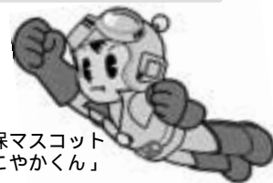
長崎県国保マスコット 「すこやかくん」