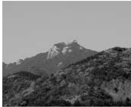
手つかずの自然が残る洲藻白嶽原始林

原始林というのは、これまで人の手が加えられることがなく、自然のままの状態が残されてきた森林のことです。日本人は古くから森林資源を利用して生活してきました。木や石、土は建築材料のほか種々の道具類に、動植物は食料にとりかかるといいます。とくに樹木は住居の材料として縄文時代から何千年もの間利用されてきました。多くの恵みを与えてくれる森林は、ときに神聖な地として信仰の対象となることがあります。