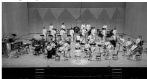
海上自衛隊佐世保音楽隊演奏会