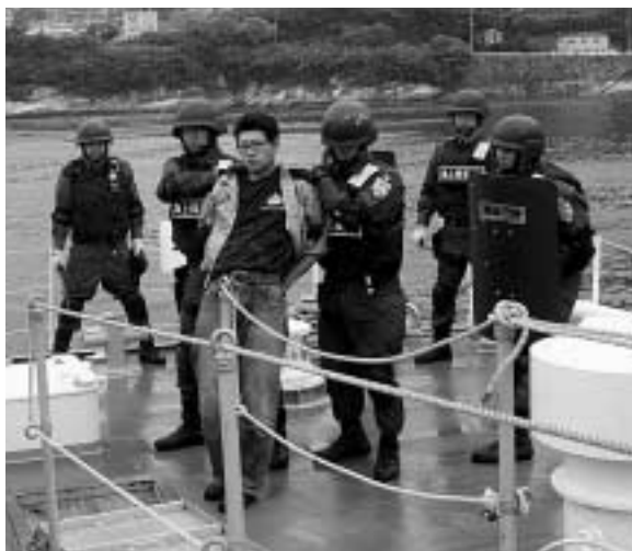
船上でテロリスト役を補足する海上保安官

対馬海上保安部、対馬南警察署、福岡入国管理局対馬出張所、門司税関厳原税関支署など厳原港の危機管理を担当する7つの行政機関で組織する厳原港港湾危機管理コアメンバーによる合同テロ対応訓練が6月2日、厳原港で実施されました。