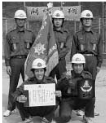
小型ポンプ操法で優勝した 厳原第8分団(安神)