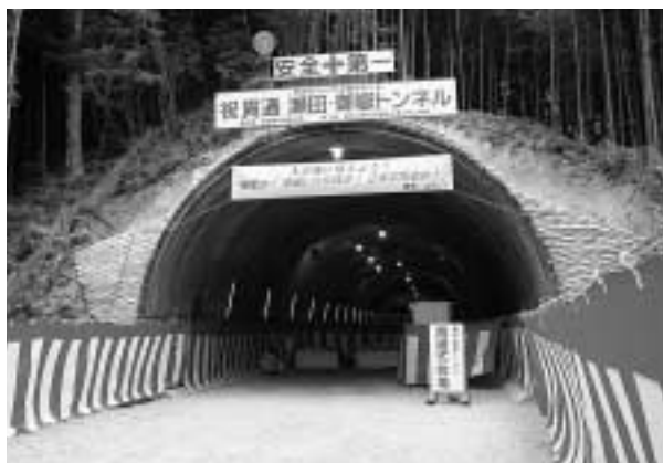
貫通した全長1,200mの御嶽トンネル

完成すると幅員が狭く急カーブが長く続く現在の路線と比較し、距離にして約1,600m、時間にして約5分短縮されます。これで通勤、通学時間の短縮をはじめ、輸送量の増強、交通の安全が図られるなど大きな効果が期待されます。今後、最終的な工事が行われ平成21年春には供用が開始される予定です。