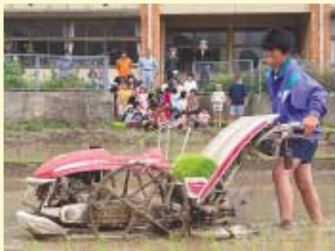
田植機の運転に挑戦する中学生

裸足になり、おそろおそろ田んぼに入った子どもたちは、農家の人から手植えの方法を教わりながら、ぎこちない手つきで苗を植えていました。小学生の中には、転ばないように中学生の手を借りながら一緒に田植えを楽しんでいた児童もいました。子どもたちは「田植えは大変だなと改めて思った」と感想を口にしていました。今後この田んぼでは、雑草取りや稲刈り、生物や野鳥の観察など年間を通して活動が実施される予定です。