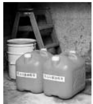
小浦地区で使用されている油回収容器。各家庭からの廃食用油が集められます。