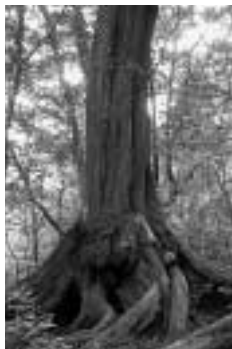
龍良山原始林の スダジイの木

（）伐採など全く人の手が入らず天然のままの状態を「原始林」、かつて手が入ったものの長い時間をかけて環境が回復したものを「原生林」といいます。