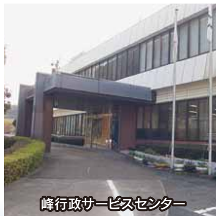
峰行政サービスセンター