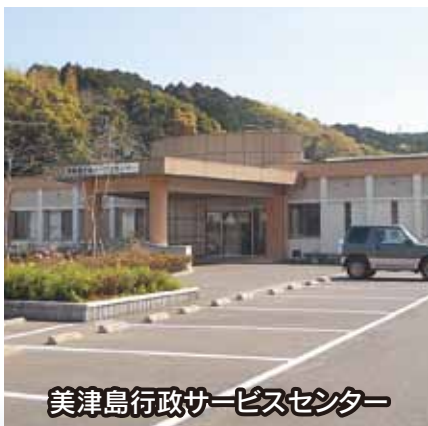
美津島行政サービスセンター