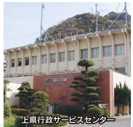
上県行政サービスセンター