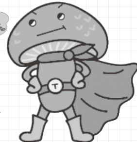
対馬市食育キャラクター