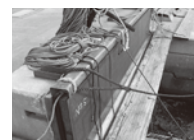
ロープなどで出入口が閉まらない 危険