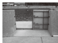
スライドゲート式