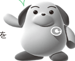
税関イメージキャラクター「カスタム君」