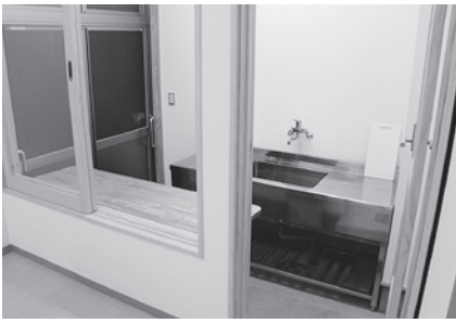
魚をさばく自慢の土間