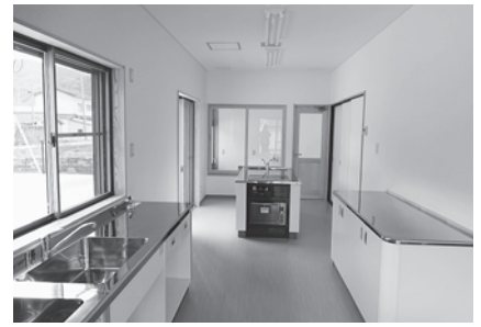
みんなで使えるアイランドキッチン