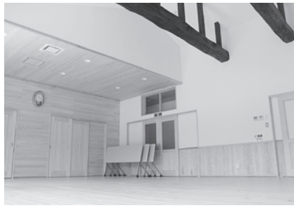
対馬産ヒノキの香る室内