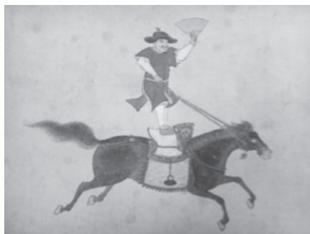
『朝鮮通信使馬上才図巻中の1図』