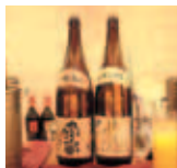
ドリンクコーナーの「対馬やまねこ」と「白嶽原酒」