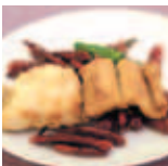
対馬の穴子と太刀魚 二品の喜び