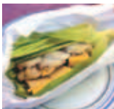
トウモロコシの香 対馬の鮑の熱々の一品