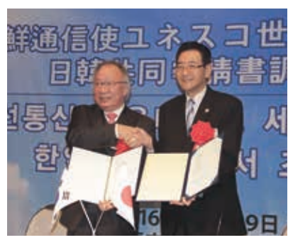
共同申請書調印式