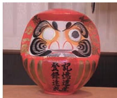
悲願達成！来年2月に墨入れ

平成28年3月に日韓の2民間団体（NPO法人朝鮮通信使縁地連絡協議会・財団法人釜山文化財団）が共同申請していた「朝鮮通信使に関する記録—17世紀～19世紀の日韓間の平和構築と文化交流の歴史」（111件、333点の資料）が10月31日に登録が決定しました。 詳細は、12月号で特集します。