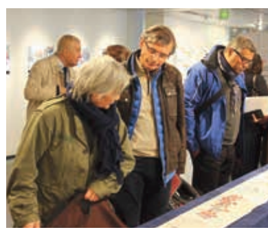
パリで初公開！朝鮮通信使資料の展示