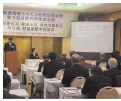
日韓共同推進会議