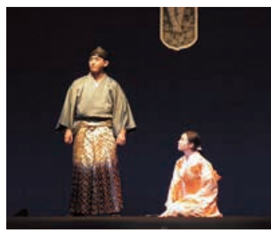
登録に向け気運を高めた劇団「漁火」による『対馬物語』の公演