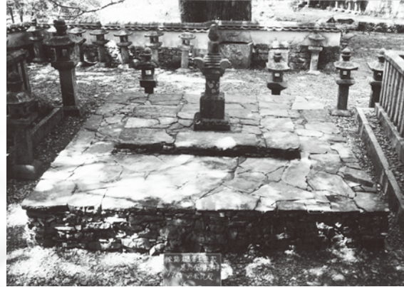
宗義智の墓（修理後）