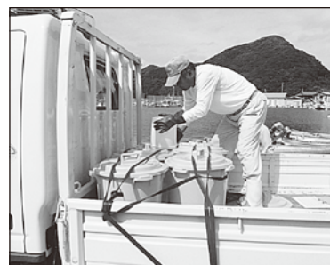
対馬農協が生ごみを回収!

3. 生ごみ収集後のバケツを洗います。(スポンジで洗い、研磨剤等を使用しないでください。)バケツが汚れない工夫をしていただいてもかまいませんが、生ごみのみ回収いたします。