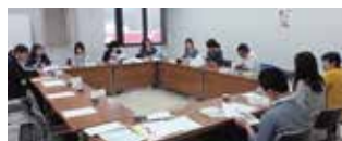
農林しいたけ課・一般社団法人daidaiの方との会食

今月から対馬産の食材を使った学校給食オリジナルレシピを毎月ご紹介いたします。子どもたちに対馬の地場産品を食べてもらうため、各調理場の栄養士と市担当者は話し合いを重ねています。