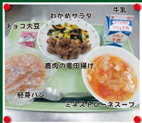
わかめサラダ 牛乳 チョコ大豆 鹿肉の竜田揚げ 胚芽パン ミネストローネスープ

学校給食のジビエ料理の定番となりました。スライスされた鹿肉なので、カラッと揚げあがりとなり、とても食べやすいです。不足しがちな鉄分の補給源となり、成長が著しく、運動量が多い児童生徒向けのメニューだと思えます。猪肉バージョンも同量でどうぞお試しください。