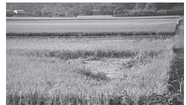
イノシシに踏み倒された稲

鳥獣による被害を防ぐために、対馬市では市の予算、国や県の補助事業を活用し、防護対策や捕獲対策を実施しています。これまでの対策の評価及び今後の対策を検討するために、被害状況の把握と防護柵の要望調査を実施します。