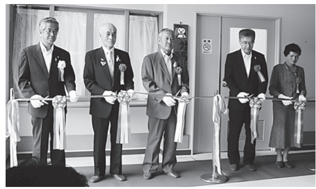
開所を祝うテープカット