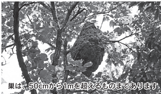
巣は、50cmから1mを超えるものまであります

ツマアカスズメバチは、環境適応性が高く繁殖力も強いので、人身への刺傷被害や対馬の生態系に与える影響が懸念されており、対馬市では環境省と協力して防除対策を実施しています。