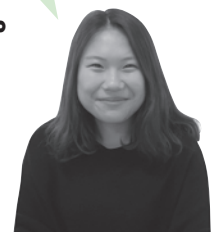
対馬市国際交流員