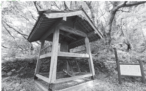
重要文化財 多久頭魂神社梵鐘

この二人、同じ「良」の字を用いているので、親子のように感じられますが、二人の間には約150年の開きがあります。先祖と子孫の関係ではないかと推定されますが、はっきりとは分かっていません。いずれにしても「阿比留氏」は1000年を超える歴史を持つ一族であり、良家・良房らはその先祖の一人と言えます。