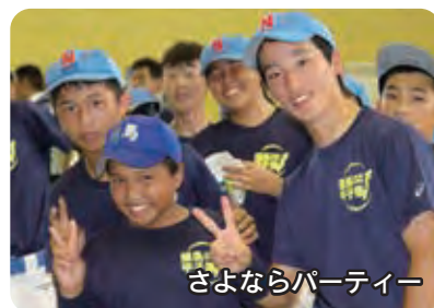
さよならパーティー