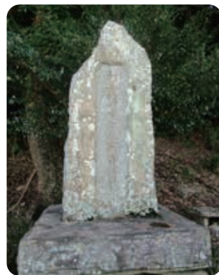
市指定史跡 中村の館跡「桜町遺跡」 (豊玉高校校舎裏)