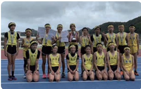
優勝した鶏鳴Aと鶏鳴Bで記念撮影!