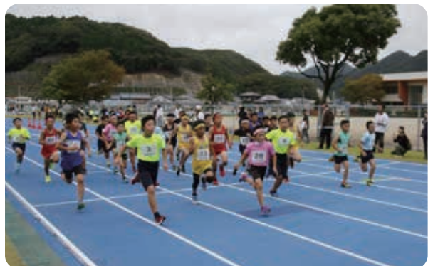
ロードレース男子スタート